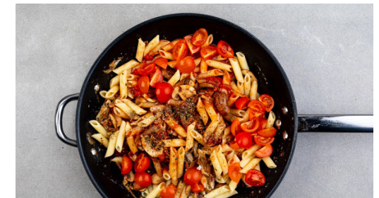
6. Pasta fertigstellen

Die Kirschtomaten vierteln. Den Käse fein reiben.