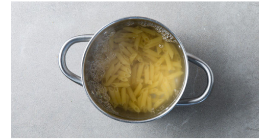
3. Pasta kochen

Die Champignons ggf. mit etwas Küchenkrepp oder einer Bürste säubern und in dünne Scheiben schneiden.