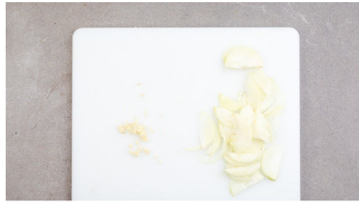
1. Zwiebeln schneiden

Energie 737kcal, Fett 17.9g, Kohlenhydrate 106.6g, Eiweiß 34.0g