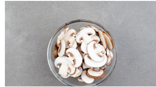
2. Pilze schneiden

In einem großen Topf ausreichend gesalzenes Wasser für die Pasta zum Kochen bringen. Die Zwiebeln schälen, halbieren und in feine Streifen schneiden. Den Knoblauch schälen und fein hacken.