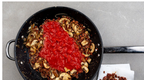
4. Sauce ansetzen

Die Pasta in das kochende Wasser geben und in 7-8Min. bissfest kochen. Mit einer Tasse ca. 100ml Pastawasser abschöpfen, dann die Nudeln in ein Sieb abgießen und abtropfen lassen.