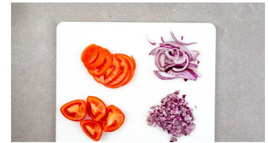
3. Tomaten schneiden

Die Süßkartoffeln auf einem mit Backpapier ausgelegten Backblech mit 1-2EL Olivenöl und 1 Prise Salz mischen, gleichmäßig verteilen und ca. 20Min. im Ofen rösten. Nach der Hälfte der Zeit wenden.