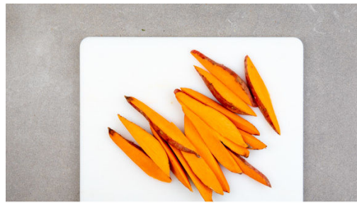
1. Süßkartoffel schneiden

Energie 771kcal, Fett 22.7g, Kohlenhydrate 106.0g, Eiweiß 32.0g