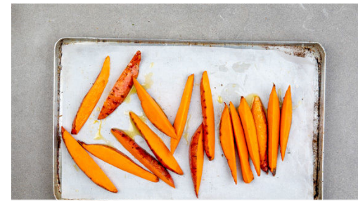
2. Süßkartoffelpommes rösten

Den Backofen auf 220°C Umluft (240°C Ober-/Unterhitze) vorheizen. Die Süßkartoffel nach Belieben schälen, dann längs halbieren und in 0,5-1cm dünne, pommesartige Stifte schneiden.