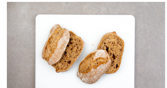
6. Burger belegen

Die Chorizo in einer großen Pfanne bei mittlerer Hitze ohne Zugabe von Fett von beiden Seiten kross anbraten, dann warm halten.