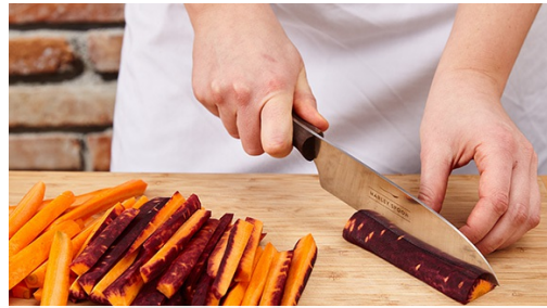
1. Wortelfriet maken

calorieën 504kcal, vet 17.8g, koolhydraten 46.9g, eiwit 33.6g