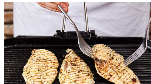
5. Kip bakken

Rasp intussen de citroenschil fijn en pers de citroen uit. Wrijf de kipfilets droog en snijd elke filet in de lengte in 2 dunnere filets . Wrijf de kipfilets in met 1-2el olijfolie, 1tl citroenrasp , Aunt Mizzi's seasoning en een snuf peper en zout. Zet opzij zodat de smaken in het vlees kunnen trekken.