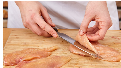
2. Kip marineren

Pluk de blaadjes van de dragon , hak ze fijn en doe de steeltjes weg. Meng de yoghurt met 1el citroensap en de dragon in een kommetje. Breng de sous op smaak met peper en zout.