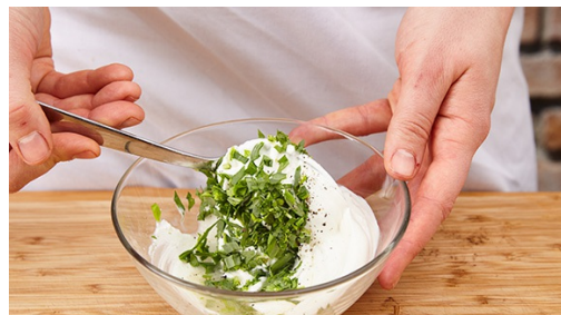
4. Yoghurtsaus maken

Verwarm de oven voor op 220°C. Schrob of schil de wortels en snijd ze in dikke, lange frietten . Hussel de wortelfriet om met 1-2el olijfolie, zout en peper en leg ze op een bakplaat met bakpapier. Bak de wortelfriet in 20-25min gaar en goudbruin. Bak in de laatste 5min de burgerbroodjes mee ( zie kooktip, links ).