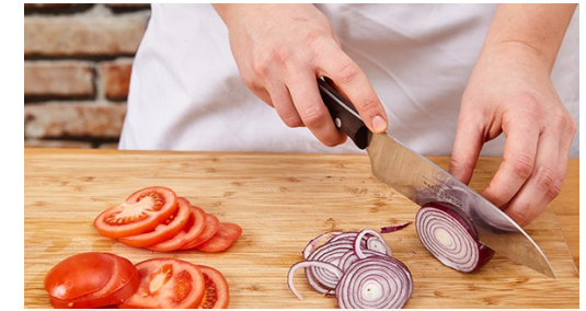
3. Groenten voorbereiden

Verhit een grillpan of grote koekenpan op hoog vuur en bak de kipfilets 4-5min per kant totdat het vlees gaar en krokant is. Zet het vuur iets lager als de kip te donker wordt.