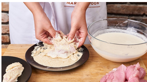
4. Nuggets maken

Breng ruim gezouten water in een grote kookpan voor de aardappels aan de kook. Boen de aardappels schoon en halveer ze in de lengte. Kook de aardappels in 15-20min beetgaar, giet af en laat uitdampen.