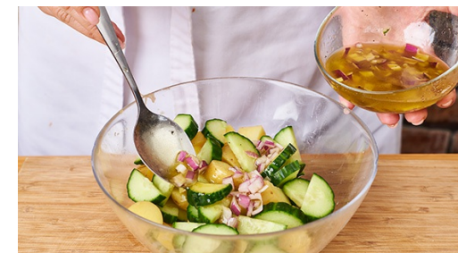
6. Aardappelsalade maken

Doe de tomaten met de ketchup , 2tl gehakte ui , de goulash spice mix en eventueel chilipeper naar smaak in een hoge (maat)beker en pureer met een staafmixer tot een grove salsa . Proef en breng op smaak met 1el olijfolie, zout en peper.