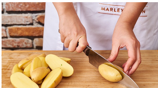
1. Aardappels koken

calorieën 679kcal, vet 25.1g, koolhydraten 68.6g, eiwit 39.4g