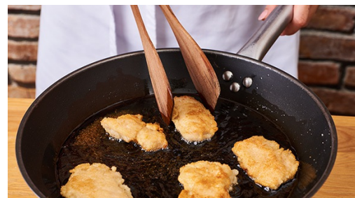
5. Nuggets bakken

Pel en hak intussen de ui grof. Hak de tomaten grof, snijd de mini-komkommers in de lengte doormidden en dan in plakjes. Wie van pittig houdt, kan de chilipeper halveren, de zaadlijsten verwijderen en de peper grof hakken.