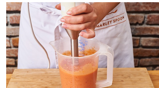
3. Salsa maken

Vul een grote koekenpan met een 1cm hoge laag plantaardige olie en verhit op middelhoog vuur. De olie is heet genoeg als deze begint te borrelen zodra je er wat beslag in laat vallen of er een houten lepel insteekt. Bak de nuggets in ca. 4-5min rondom goudbruin en krokant. Neem de nuggets uit de pan en laat ze op keukenpapier uitlekken. Bestrooi ze met zout.