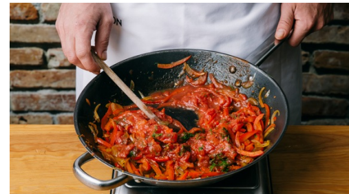
5. Sugo maken

Verhit een grote koekenpan met 1-2el olijfolie op middelhoog vuur en bak de gnocchi in 8-10min rondom goudbruin en knapperig. Roer regelmatig door en breng op smaak met peper en zout. Houd de gnocchi warm tot aan het serveren.