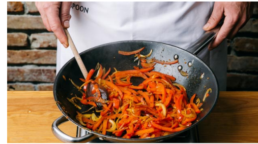
2. Paprika bakken

Halveer, pel en snijd de ui in dunne, halve ringen.