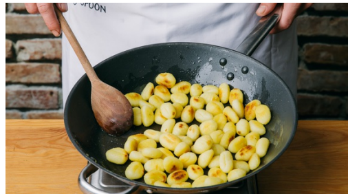
4. Gnocchi bakken

Hak de dille zonder de harde steeltjes fijn, houd een paar dunnere dilletakjes apart voor stap 6. Snijd de bosui schuin in smalle ringen.