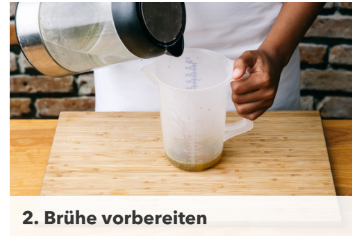
2. Brühe vorbereiten

Die Zwiebeln schälen, halbieren und in feine Würfel schneiden.