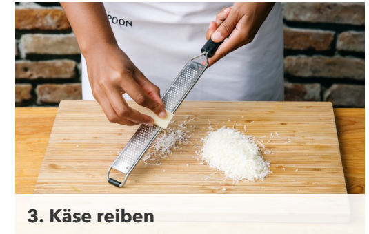
3. Käse reiben

In einem Wasserkocher 1,2L Wasser aufkochen und den Brühwürfel darin auflösen lassen.