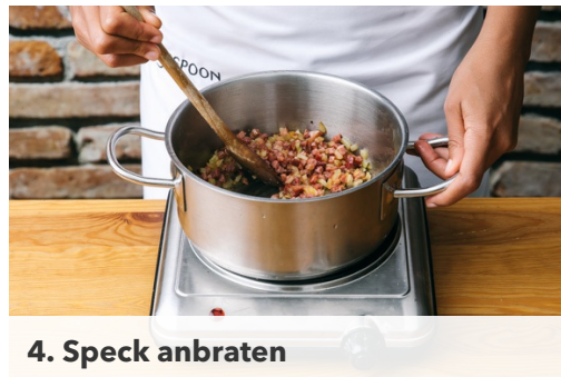
4. Speck anbraten

Inzwischen den Käse mit einer Küchenreibe fein reiben.