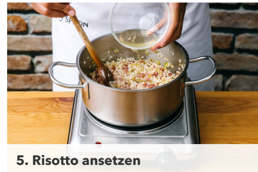
5. Risotto ansetzen

Nun den Speck mit 1EL Olivenöl in einem mittleren Topf ca. 2-3Min. kross anbraten, dann die Zwiebel hinzugeben und ca. 1Min. weiter dünsten.