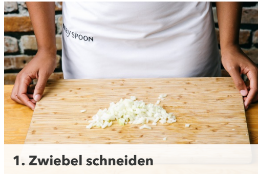
1. Zwiebel schneiden

Energie 715kcal, Fett 25.3g, Kohlenhydrate 94.0g, Eiweiß 26.4g