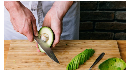
5. Avocado snijden

Verhit een kleine koekenpan zonder olie op middelhoog vuur. Voeg de pompoenpitten toe en bak al roerend ca. 3-5min totdat de pitten een ploppend geluid beginnen te maken. Neem pan van het vuur en meng de pitten met 1tl olie en zout. Laat afkoelen.