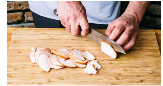
3. Kip snijden

Halveer de cherrytomaten . Snijd stronkje van de bosui , snijd overlangs in vieren en hak dan fijn.