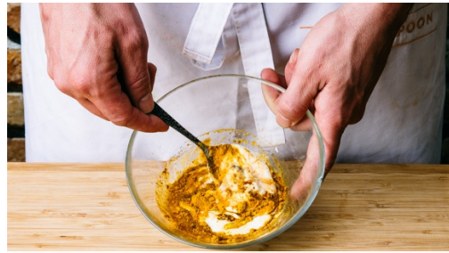
1. Currysaus maken

calorieën 435kcal, vet 29.5g, koolhydraten 9.3g, eiwit 28.5g