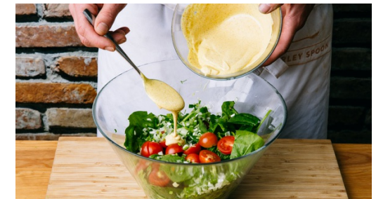
6. Salade samenstellen

Snijd intussen de avocado in de lengte tot op de pit rondom in. Draai de avocadohelften in tegengestelde richting om open te maken. Gebruik een mes om te pit los te wrikken. Pel de avocadohelften en snijd elke helft in 0,5-1cm brede plakken.