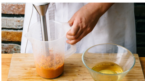
4. Saus maken

Verwarm de oven voor op 200°C hetelucht/220°C. 200ml water in waterkoker aan de kook brengen. Gedroogde tomaten in een kom doen en met het zojuist gekookte water overgieten en ca.10min laten wellen. Rol het pizzadeeg met aanklevend bakpapier uit op 1 bakplaat en vouw evt. randjes om voor een knapperige korst.