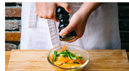
6. Salade maken

Pel rode ui , halveer deze en snijd in dunne halve ringen. Pluk de blaadjes van de oregano , gooi de steeltjes weg. Snijd de tomaat in blokjes.