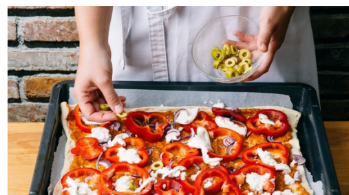
5. Pizza bakken

Snijdt paprika's in 0,5-1cm brede ringen, verwijder daarbij het steeltje, de zaden en zaadlijsten. Mozzarella uit laten lekken en in grove stukken scheuren.