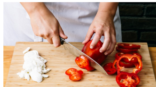
2. Ingrediënten voorbereiden

Neem de gedroogde tomaten uit het water en doe ze in de hoge beker. Doe de helft van de olijven, oregano en gehakte tomaten erbij en voeg 1-2el olijfolie toe. Pureer met een staafmixer tot een gladde saus , breng op smaak met peper en zout. Voeg evt. 1-2 el van het tomatenwater toe.