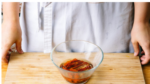
1. Gedroogde tomaten wellen

calorieën 850kcal, vet 46.8g, koolhydraten 81.6g, eiwit 20.0g