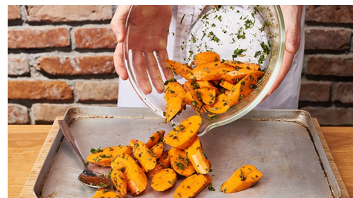
2. Wortels roosteren

Oven op 180°C hetelucht/200°C voorverwarmen. Wortels evt. schillen en schuin in ca. 1-2cm brede plakken snijden. Rozemarijnnaaldjes en oreganoblaadjes plukken, samen fijnsnijden en steeltjes wegdoen.