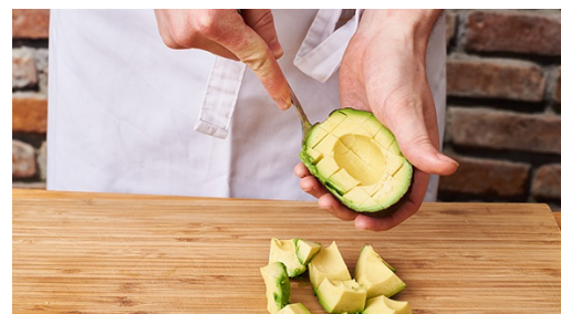
5. Avocado snijden

Na 10-15min baktijd, de bonen aan de wortelbakplaat toevoegen en alles nog ca. 10min in de oven bakken.