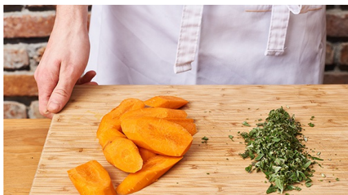
1. Wortels snijden

calorieën 560kcal, vet 30.1g, koolhydraten 40.3g, eiwit 22.4g