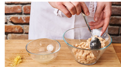
3. Ingrediënten voorbereiden

Wortels met 2tl olijfolie en gehakte oregano en rozemarijn mengen, op smaak brengen met peper en zout en gelijkmatig over een bakplaat verdelen. In ca. 10-15min goudbruin bakken.