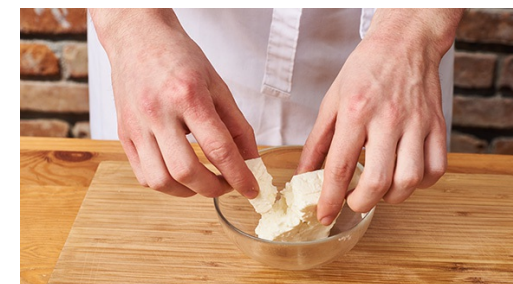
6. Gerecht afmaken

Ondertussen avocado in de lengte halveren, pit verwijderen en met een mes een ruitjespatroon in het vruchtvlees kerven. Dan met een eetlepel het vruchtvlees uit de schil scheppen, met 1-2el citroensap besprenkelen. Mesclunsla met 1tl olie en avocado mengen. Met zout en peper en meer citroensap naar wens op smaak brengen.