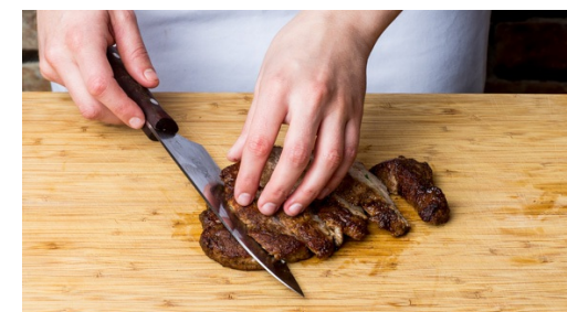
6. Vlees snijden

Zodra het water kookt, wortels toevoegen en in ca. 8min beetgaar koken. Afgieten en opzij zetten.