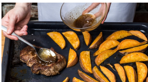
4. Varkensvlees glaceren

Oven op 200°C hetelucht/220°C voorverwarmen. Ruim water in middelgrote kookpan aan de kook brengen. 1/2 garam masala met 1el olijfolie, peper en zout mengen. Varkensprocureur ermee inwrijven. Zoete aardappels in 1-1,5cm brede wedges snijden. Paarse wortels in de lengte halveren en 2cm brede stukken snijden. Meiknollen schillen, in 2cm grote blokjes snijden.