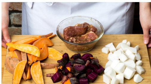
1. Ingrediënten voorbereiden

calorieën 740kcal, vet 19.6g, koolhydraten 88.1g, eiwit 42.7g