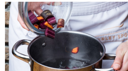
3. Wortels koken

Ondertussen bieslook fijnsnijden ( zie kooktip, links ). Helft van de yoghurt, 1tl honing, 1-2el olijfolie, 1el azijn en gehakte bieslook in een kom mengen. Geheel op smaak brengen met zout en peper, wortels en meiknollen met sous mengen. Evt. meer yoghurt toevoegen of voor bijv. ontbijt bewaren.