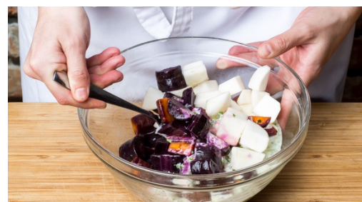
5. Salade maken

Een grote koekenpan op hoog vuur verhitten en een dun laagje olie toevoegen. Vlees in de pan doen en in 3-5min rondom dichtschroeien. Intussen wedges op een kant van een bakplaat leggen. Met 1-2el olie besprenkelen en met zout en peper bestrooien. Leg het gebakken vlees ook op de bakplaat en bak ca. 8min in de oven.