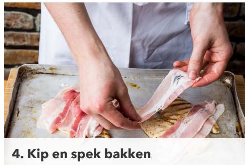
4. Kip en spek bakken

Verwarm de oven voor op 220°C. Bak de burgerbroodjes op een bakplaat met bakpapier in 4-5min in de oven af. Snijd elke kipfilet in de lengte in twee dünnere filets . Wikkel de kip in vershoudfolie en sla het vlees met een zwaar voorwerp gelijkmatig plat. Verwijder de folie en wrijf de kip in met 1el plantaardige olie, peper en zout.