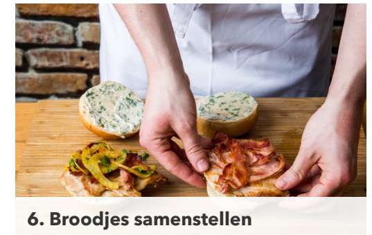
6. Broodjes samenstellen

Schil de wortels , snijd ze in de lengte doormidden en dan in plakjes. Snijd de venkels doormidden, verwijder de stronk en snijd de venkels in smalle reepjes. Hak de peterselie en dragon beiden zonder de harde steeltjes grof. Maak een dressing van 1el mosterd , 1-2el honing of suiker, 2el azijn, 2-3el olijfolie en 1-2el water plus zout en peper naar wens.