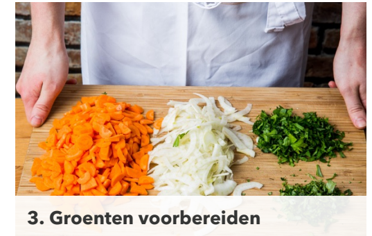
3. Groenten voorbereiden

Verhit intussen de gebruikte pan op middelhoog vuur en bak de wortel en venkel 7-10min totdat de venkel bruin begint te kleuren en zachter is. Schep af en toe om. Doe de groenten in een kom met de dressing en gehakte peterselie en roer door. Proef en breng de salade op smaak met peper en zout.