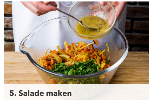
5. Salade maken

Verhit intussen 1el olie in een grote koekenpan of grillpan op hoog vuur en wacht tot de pan goed heet is. Bak de kip in 1-2min per kant goudbruin. Neem de kipfilets uit de pan en leg ze op een bakplaat. Je hoeft de pan niet schoon te vegen.