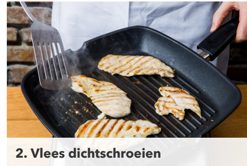
2. Vlees dichtschroeien

Leg de spekplakjes over de kip . Zorg ervoor dat de broodjes op dit moment uit de oven zijn en zet de oven op de hoogste temperatuur (evt. met de grill aan). Bak de kip met het spek 4-5min in de oven totdat het spek krokant is.