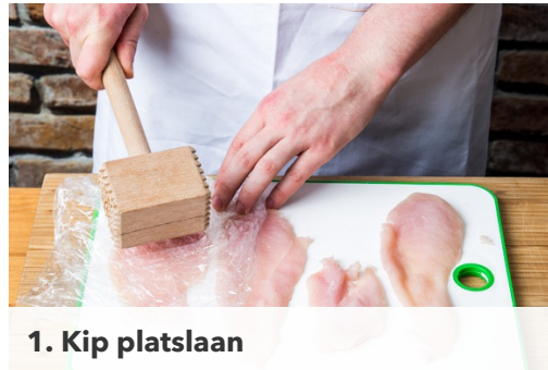
1. Kip platslaan

calorieën 775kcal, vet 47.9g, koolhydraten 48.7g, eiwit 35.7g