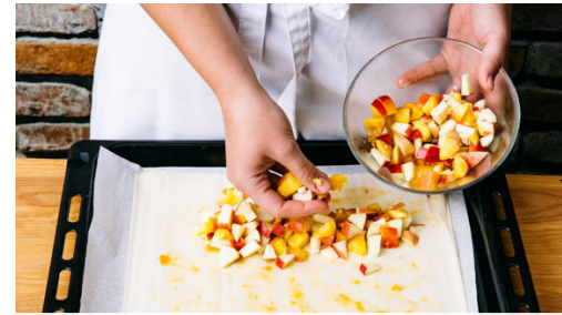
2. Strudel vorbereiten

Inzwischen die Mandeln grob hacken. Eine kleine Pfanne mit 1,5EL Zucker auf mittlerer Stufe erhitzen, bis der Zucker flüssig und goldgelb wird.