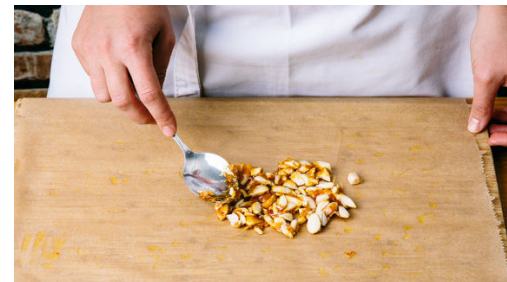
5. Mandelkrokant zubereiten

Jeweils 5 Teigblätter auf die Backblech legen, dabei zwischen jedes Teigblatt etwas geschmolzene Butter oder Pflanzenöl pinseln. Die obersten Teigplatten gleichmäßig mit Aprikosenmarmelade bestreichen und mit je 1EL Zucker bestreuen. Das Obst auf den unteren Dritteln der Teigplatten verteilen, dabei je einen ca. 2cm breiten Rand frei lassen.