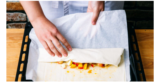
3. Strudel aufrollen

Die Mandeln in die Pfanne geben und gut mit dem Karamell vermischen, dann die Masse auf einem eingefetteten Stück Backpapier dünn verstreichen und bis zum Servieren auskühlen lassen.