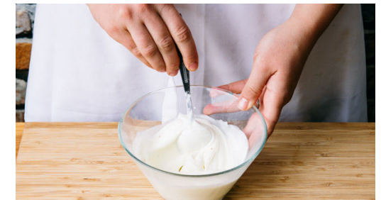
6. Topfen verfeinern

Die Strudel nun von der gefüllte Seite aus aufrollen und die Enden gut mit den Fingern zusammendrücken. Vorsichtig mit der Schließstelle nach unten drehen und die Strudel 15-20Min. im Ofen goldbraun backen.