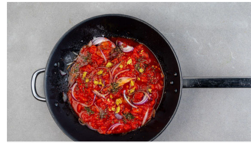
2. Tomatensugo kochen

Die Zucchini in ca. 0,5cm dünne Scheiben schneiden und mit den Oliven zum Tomatensugo geben. Bei niedriger Hitze 5-8Min. mitköcheln lassen, bis die Kartoffeln gar sind. Inzwischen die Zitronenschale abreiben, dann die Zitrone in Spalten schneiden.