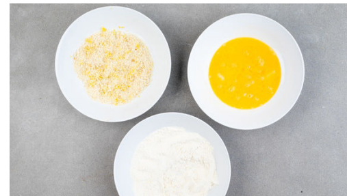
5. Panade vorbereiten

Die Zwiebeln und die 1/2 des Knoblauchs in einer großen Pfanne mit 1EL Olivenöl bei mittlerer Hitze 1-2Min. anbraten. Mit den gehackten Tomaten ablöschen und den Brühwürfel darin auflösen. Die Sauce sanft köcheln lassen und mit dem Rosmarin nach Geschmack sowie Salz, Pfeffer und Zucker würzen.