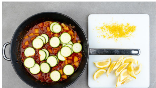
4. Zucchini schneiden

Die Zwiebel schälen, halbieren und in feine Streifen schneiden. Die Rosmarinnadeln abzupfen und fein hacken. Den Knoblauch schälen und sehr fein hacken oder durch eine Knoblauchpresse drücken.