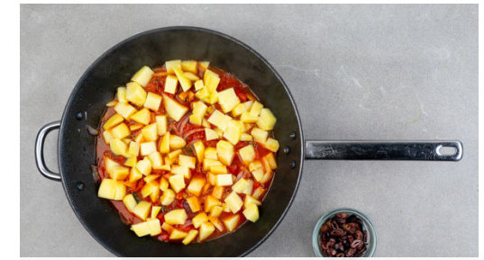
3. Kartoffeln zubereiten

Für die Panade 4-6EL Mehl auf einen tiefen Teller geben. In einem weiteren tiefen Teller 2 Eier mit dem restlichen Knoblauch und 1-2EL Wasser verquirlen. Das Panko-Paniermehl auf einen dritten tiefen Teller geben und mit 1-2EL Zitronenabrieb vermengen. Das Fleisch trocken tupfen, in 4 gleich große Stücke schneiden und mit einem Fleischklopfer ca. 0,5cm dünn plattieren.