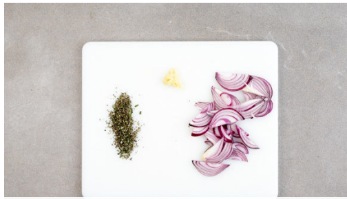
1. Zwiebel schneiden

Kalorien 579.0kcal, Fett 22.2g, Eiweiß 41.8g, Kohlenhydrate 49.8g