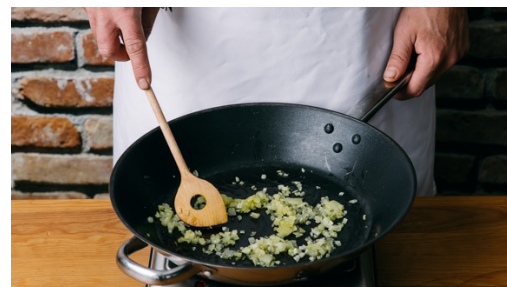
2. Ui bakken

Doe de walnoten , het granaatappelextract , 2-3el water en 1-2el olijfolie bij de gebakken paprika in de beker en pureer met een staafmixer tot een grove saus . Breng op smaak met zout en peper.