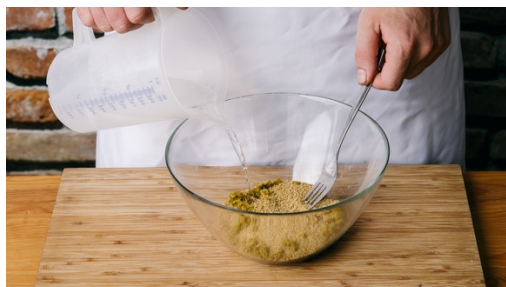
1. Couscous garen

calorieën 687.0kcal, vet 29.5g, eiwit 34.9g, koolhydraten 66.5g