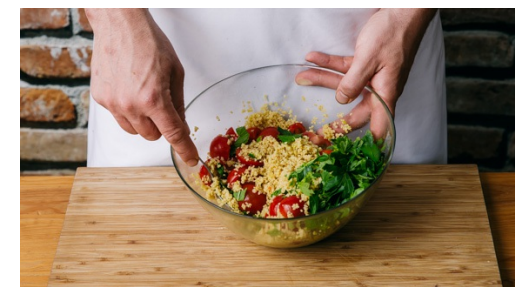
6. Couscous afmaken

Pluk de blaadjes van de mint en peterselie en hak de blaadjes grof, doe de steeltjes weg. Halveer de cherrytomaten .