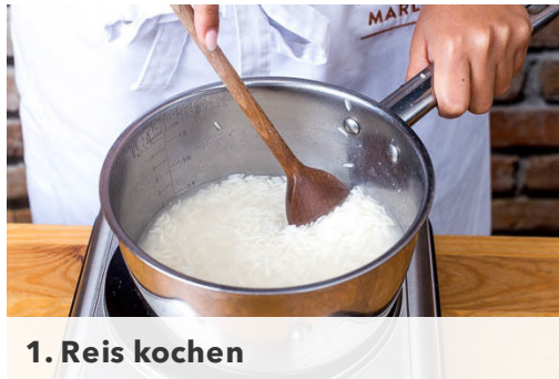
1. Reis kochen

Kalorien 872.0kcal, Fett 39.7g, Eiweiß 23.2g, Kohlenhydrate 96.9g