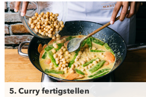
5. Curry fertigstellen

Währenddessen die Karotte schälen und schräg in dünne Scheiben schneiden. Die Enden der Bohnen abschneiden und die Bohnen dritteln. Die Kichererbsen in einem Sieb gut abtropfen lassen.