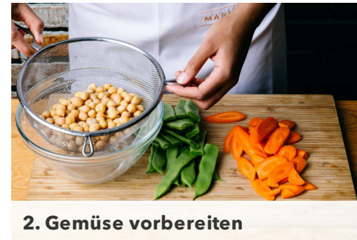
2. Gemüse vorbereiten

Die Karotten und die Bohnen in derselben Pfanne mit 1-2EL Pflanzenöl bei mittlerer Hitze 4-6Min. anbraten.