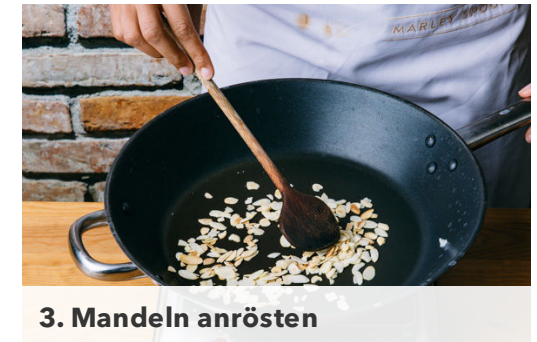
3. Mandeln anrösten

Die Kokosmilch unterrühren und je nach Schärfewunsch mit der Curypaste würzen. Das Curry auf niedrigster Stufe 4-5Min. sanft köcheln lassen. Mit Salz und Pfeffer abschmecken und die Kichererbsen untermischen.