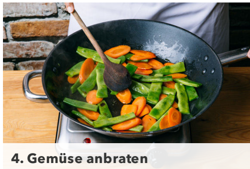
4. Gemüse anbraten

In einem mittelgroßen Topf 400ml leicht gesalzenes Wasser zum Kochen bringen. Den Reis in einem Sieb unter fließendem Wasser abspülen, bis das Wasser klar bleibt. Sobald das Wasser kocht, den Reis bei niedrigster Hitze abgedeckt ca. 10-12Min. kochen, bis das Wasser komplett aufgesogen und der Reis gar ist. Noch ca. 5Min. ohne Hitze abgedeckt ziehen lassen.