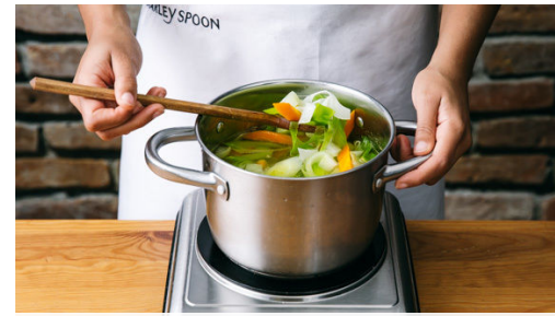
2. Gemüse garen

Das Fleisch mit etwas Küchenkrepp trocken tupfen, ggf. von Sehnen befreien und in 6-8 Medallions schneiden. Mit Salz und Pfeffer würzen und in einer mittelgroßen, ofenfesten Pfanne mit 1EL Olivenöl bei starker Hitze auf jeder Seite 1-2Min. scharf anbraten.