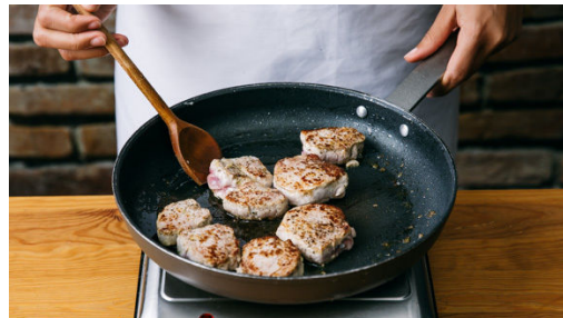
4. Fleisch anbraten

Den Backofen mit Grillfunktion auf 180°C vorheizen. In einem mittelgroßen Topf ausreichend gesalzenes Wasser für das Gemüse aufsetzen. Den Kohlrabi schälen und in ca. 1cm große Würfel schneiden. Die Karotte schälen, längs halbieren und schräg in ca. 1cm dünne Scheiben schneiden. Den Lauch und den Stangensellerie ebenfalls schräg in ca. 1cm dünne Scheiben schneiden.