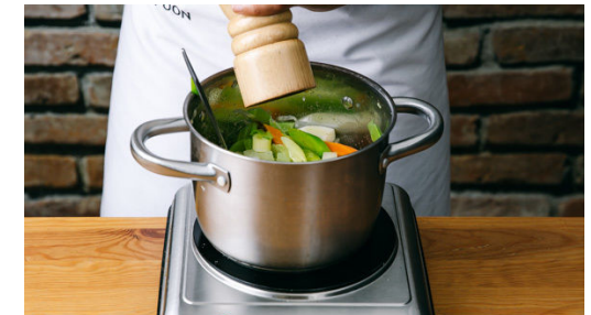
6. Gemüse abschmecken

Inzwischen die Rosmarinnadeln von den Stängeln zupfen, die Thymianblätter abstreifen und beides fein hacken. Die Petersilie samt Stängeln ebenfalls fein hacken und alle Kräuter mit 1-2TL Butter und ca. 2 gehäuften EL Panko-Paniermehl vermischen. Mit Salz und Pfeffer abschmecken.