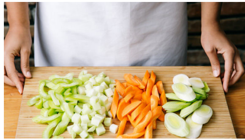
1. Gemüse schneiden

Kalorien 441.0kcal, Fett 18.0g, Eiweiß 39.2g, Kohlenhydrate 26.2g