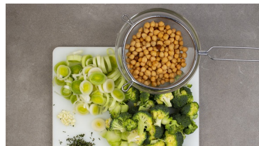
2. Gemüse vorbereiten

Inzwischen die abgetropften Kichererbsen mit dem geräucherten Paprikapulver nach Geschmack , 1/2EL Olivenöl sowie Salz und Pfeffer verrühren und auf einem mit Backpapier ausgelegten Backblech verteilen. Die Kichererbsen im Ofen ca. 15Min. backen, bis sie knusprig sind.