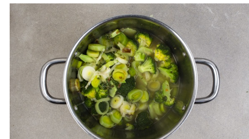
3. Suppe ansetzen

Die getrockneten Tomaten in feine Streifen schneiden. Sobald die Kichererbsen knusprig sind, das Blech aus dem Ofen nehmen und die Tomatenstreifen mit den Kichererbsen mischen. Die Kresse mit einer Schere vom Beet schneiden und einen Teil der Kresse unter die Kichererbsen-Tomaten-Mischung mengen.