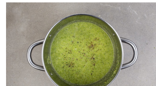
6. Suppe pürieren

Den Lauch und den Knoblauch in der Pfanne ca. 3-5Min. anbraten, bis der Lauch leicht gebräunt ist. Dann mit dem Brokkoli und dem Brühwürfel in das kochende Wasser geben und die Suppe bei hoher Hitze 12-15Min. köcheln lassen, bis der Brokkoli weich ist. Bei Bedarf etwas mehr Wasser hinzugeben. Dann die 1/2 des Thymians unterrühren.