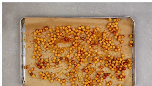
4. Kichererbsen vorbereiten

Den Backofen auf 200°C Umluft (220°C Ober-/Unterhitze) vorheizen. Die Petersilienblätter von den Stängeln zupfen und in einer großen Pfanne mit 1-2EL Olivenöl bei hoher Hitze ca. 30Sek. frittieren, bis die Petersilie an den Rändern knusprig braun ist. Die Petersilie mit einer Schaumkelle aus der Pfanne nehmen und auf Küchenkrepp abtropfen lassen.