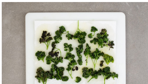
1. Petersilie frittieren

Kalorien 485.0kcal, Fett 22.8g, Eiweiß 24.2g, Kohlenhydrate 37.8g