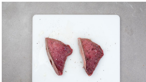
4. Fleisch vorbereiten

Das Fleisch Raumtemperatur annehmen lassen. Den Backofen auf 200°C Umluft (220°C Ober-/Unterhitze) vorheizen. Die Kartoffeln schälen und in ca. 2-3cm große Würfel schneiden. Mit 1 großzügigen Prise Paprikapulver , etwas Salz und 1EL Olivenöl vermengen, auf einem mit Backpapier ausgelegten Backblech verteilen und im Ofen in ca. 15-20 Min. goldbraun backen.