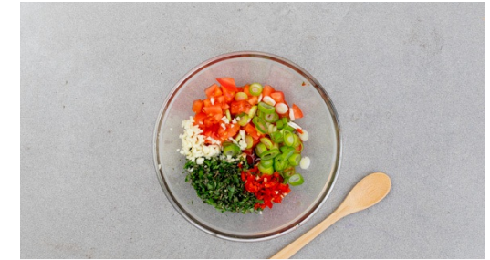
3. Chimichurri zubereiten

Das Fleisch in einer großen Pfanne ca. 3-5Min. bis zum gewünschten Garpunkt anbraten, dabei einmal wenden. Je nachdem, wie dick das Fleisch ist und ob man es „raw“, „medium“ oder „well done“ bevorzugt, variiert die Garzeit. Das Fleisch aus der Pfanne nehmen und noch einige Minuten ohne Hitzezufuhr ruhen lassen.