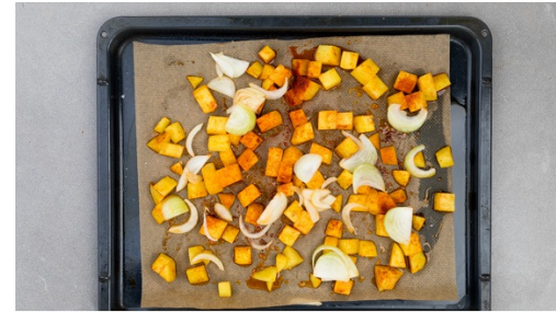
2. Zwiebeln mitbacken

Das Fleisch mit etwas Küchenkrepp trocken tupfen und halbieren, dann mit 1EL Olivenöl einreiben und mit Salz und Pfeffer würzen.