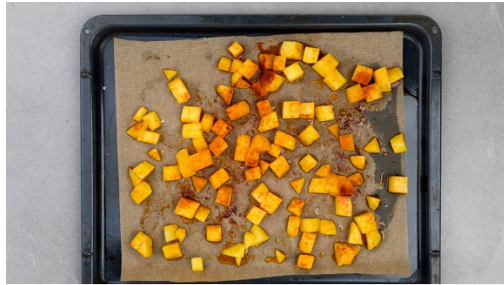
1. Kartoffeln backen

Kalorien 614.0kcal, Fett 31.7g, Eiweiß 33.4g, Kohlenhydrate 45.0g