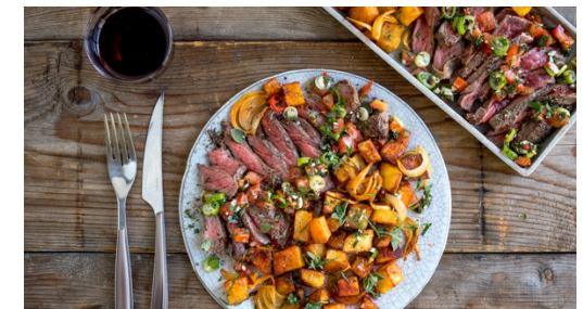
6. Anrichten und servieren

Die Tomaten in ca. 0,5cm große Würfel schneiden. Die Petersilien-, Thymian- und Oreganoblättchen von den Stängeln zupfen und fein hacken. Die Lauchzwiebel in feine Ringe schneiden. Den Knoblauch schälen und fein hacken. Je nach Schärfewunsch ca. 1/3 der Chilischote fein hacken. Für das Chimichurri alles mit 2-3EL Olivenöl und 1EL (hellem) Essig vermengen.