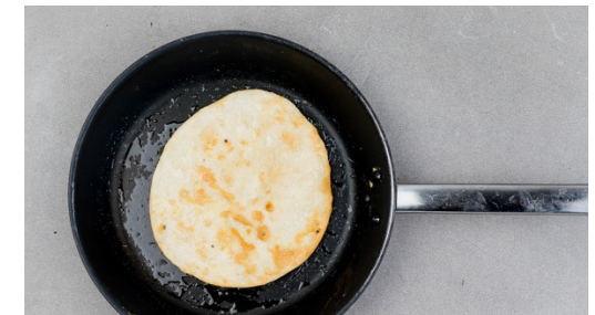
6. Tortillas backen

Die Sauce zum Gemüse in die Pfanne geben und alles bei niedriger Hitze leicht einköcheln lassen. Währenddessen 1 Ei in einen tiefen Teller aufschlagen und mit einer Gabel gut verquirlen, mit Salz und Pfeffer würzen.