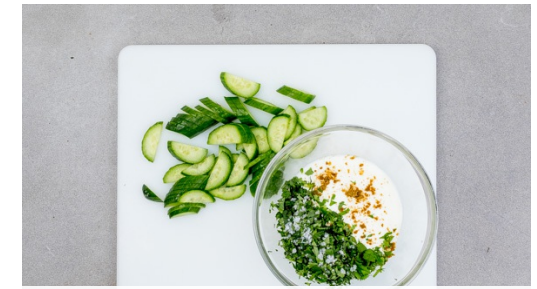
3. Joghurdip anrühren

Die Pilze in einer großen Pfanne bei starker Hitze ca. 2Min. anbraten. 1-2EL Pflanzenöl dazugeben und die Kartoffelwürfel unterrühren. Ca. 5-8Min. braten, bis die Kartoffeln bissfest und an den Rändern knusprig sind.