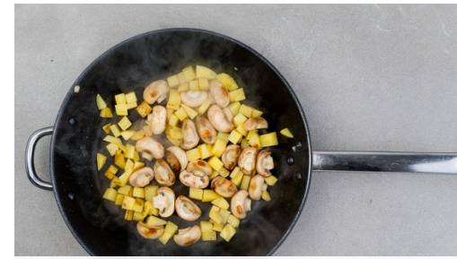
2. Gemüse braten

Die Kartoffeln schälen und in ca. 1,5cm große Würfel schneiden. Die Champignons ggf. mit etwas Küchenkrepp oder einer Bürste säubern, dann je nach Größe halbieren oder vierteln. Die Tomaten halbieren, entkernen und in ca. 0,5cm kleine Würfel schneiden, die Tomatenkerne beiseitestellen.