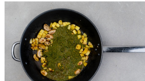
5. Sauce einkochen

Den Grünkohl , die Korianderstängel , die Tikka-Masala-Paste , die Tomatenkerne und ca. 150ml Wasser in einem hohen Gefäß mit einem Stabmixer zu einer glatten Sauce pürieren, dabei falls nötig etwas mehr Wasser zugeben.