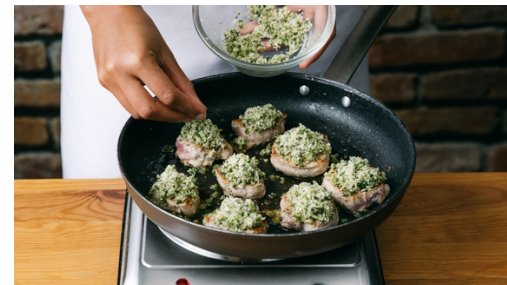
5. Medaillons grillen

Den Kohlrabi , die Karotten und den Sellerie im kochenden Wasser ca. 6-8Min. bissfest garen. Den Lauch in der letzten Minute zugeben und mitkochen. Das Gemüse in ein Sieb abgießen, kurz abtropfen lassen und wieder zurück in den Topf geben. Beiseitestellen.