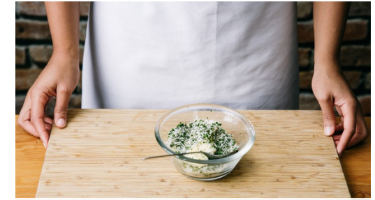
3. Panko mischen

Die Medaillons mit der Panko-Kräuter-Mischung bestreichen, dabei die Panko-Kruste etwas andrücken. Im Ofen ca. 6-8Min. knusprig übergrillen.