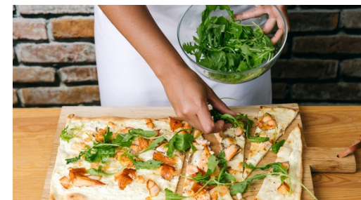
6. Flammkuchen servieren

2-3EL Olivenöl mit 2EL Essig, Salz, Pfeffer und 1 Prise Zucker zu einer Vinaigrette verrühren. 2-3EL der Vinaigrette mit dem Rucola mischen. Mit der restlichen Vinaigrette die Gurken und die Lauchzwiebeln anmachen.