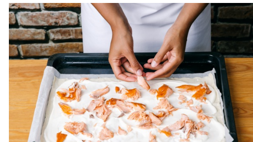
3. Flammkuchen belegen

Die Crème fraîche glatt rühren und mit Salz und Pfeffer abschmecken.