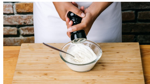
2. Crème fraîche würzen

Den Backofen auf 200°C Umluft vorheizen. Die Räucherlachsspitzen ggf. mit einem scharfen Messer von der Haut befreien und mit den Fingern oder einer Gabel vorsichtig zerteilen.