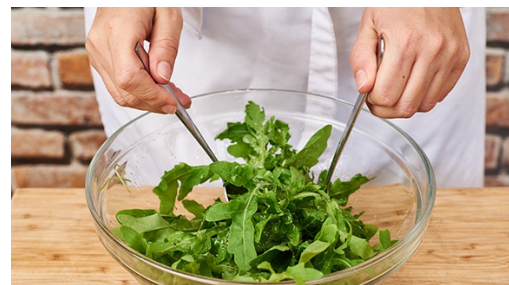
5. Salat mischen

Währenddessen die Enden der Gurke abschneiden und die Gurke nach Wunsch schälen. Die Gurke längs vierteln und in dünne Scheiben schneiden. Die Lauchzwiebeln putzen und schräg in feine Ringe schneiden.