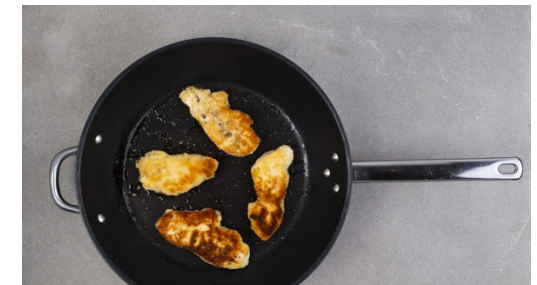
6. Schnitzel braten

Das gekochte Ei halbieren und fein hacken. Die Lauchzwiebel schräg in feine Ringe schneiden. Die Mayonnaise mit den Lauchzwiebeln , 2-3EL Wasser, Salz, Pfeffer und 1-2TL Essig verrühren, dann das gehackte Ei vorsichtig unterheben.