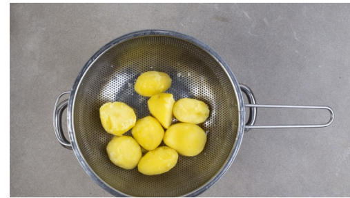
2. Kartoffeln kochen

Die Kartoffeln in ca. 0,5cm große Scheiben schneiden. Die Salatsauce vorsichtig mit den Kartoffeln vermengen. Ggf. noch etwas Wasser hinzugeben und nach Wunsch erneut mit Salz, Pfeffer und Essig abschmecken.