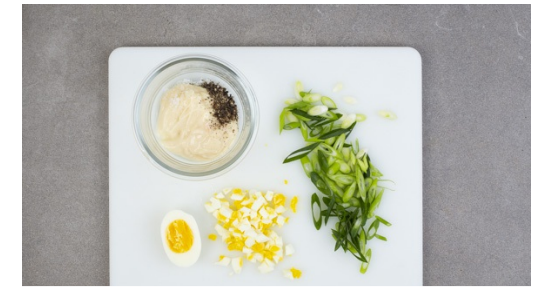
3. Salatsauce vorbereiten

Die Hähnchenbrust schräg in ca. 4 dünne Schnitzel schneiden und mit Salz und Pfeffer würzen. Das restliche Ei mit einer Gabel verquirlen. Die Schnitzel nacheinander in etwas Mehl wenden, durch das verquirlte Ei ziehen und in den Semmelbröseln wenden, bis sie gut bedeckt sind. Die Panade leicht andrücken.