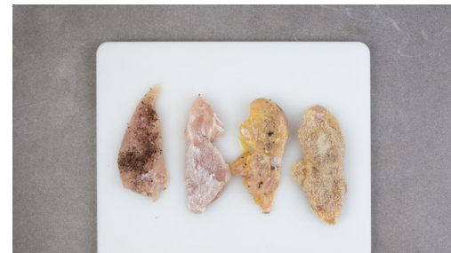
5. Schnitzel panieren

In einem großen Topf ausreichend leicht gesalzenes Wasser für die Kartoffeln zum Kochen bringen. Die Kartoffeln schälen, größere Kartoffeln halbieren. Im kochenden Wasser in 15-20Min. gar kochen. Tipp: Die Kartoffeln sind durch, wenn sie sich bei der Messerprobe leicht vom Messer lösen. Die Kartoffeln in ein Sieb abgießen und kurz abkühlen lassen.