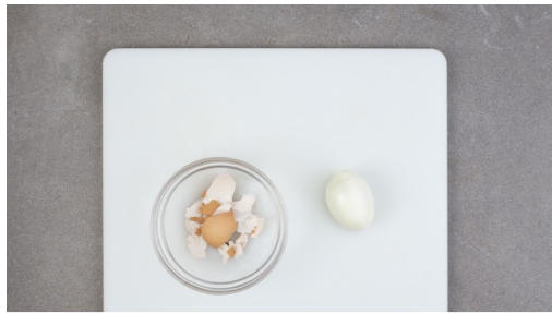
1. Ei kochen

Kalorien 641.0kcal, Fett 25.3g, Eiweiß 42.8g, Kohlenhydrate 53.9g