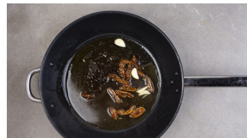
5. Feigen anbraten

Kotelett mit etwas Küchenkrepp trocken tupfen und mit einem scharfen Messer von der Sehne befreien. Mit Salz und Pfeffer würzen und in einer großen Pfanne mit 1EL Olivenöl bei mittlerer Hitze auf jeder Seite 1-2Min. anbraten. Das Fleisch mit dem gehackten Knoblauch zum Gemüse auf das Blech geben und im Rohr ca. 6-8 Min. mitgaren, bis das Fleisch durch ist.