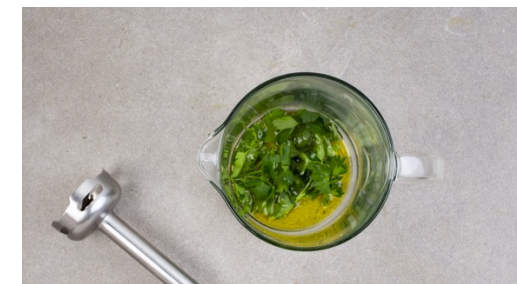
6. Petersilienöl zubereiten

Die Feigen und übrigen Knoblauch in derselben Pfanne im Bratensaft auf niedriger Hitze ca. 2-3 Min. anbraten. Tipp: Sollte beim Anbraten des Koteletts nur wenig Bratensaft entstanden sein, zusätzlich 1EL Olivenöl verwenden. Mit ca. 50ml Wasser ablöschen und 1-2Min. sanft köcheln lassen, bis das Wasser reduziert ist.