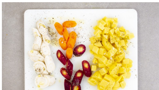
1. Gemüse vorbereiten

Kalorien 643.0kcal, Fett 30.6g, Eiweiß 37.0g, Kohlenhydrate 46.5g