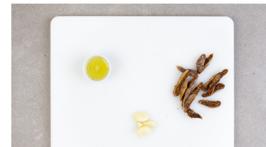
3. Knoblauch schneiden

Das Gemüse auf ein mit Backpapier ausgelegtes Backblech geben, dabei etwas Platz für die Schweinekoteletts lassen. Im Rohr ca. 25-30Min. rösten, bis das Gemüse gar und an den Rändern goldbraun ist.