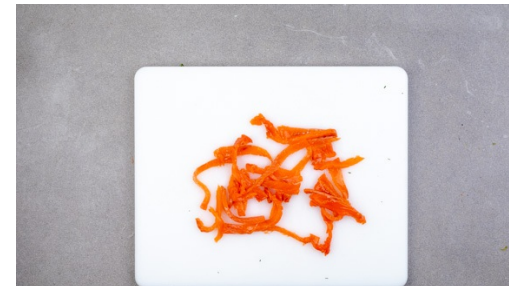
2. Seelachs vorbereiten

In einem mittelgroßen Topf ausreichend leicht gesalzenes Wasser für die Pasta zum Kochen bringen. Die Zwiebel und den Knoblauch schälen, halbieren und hacken.