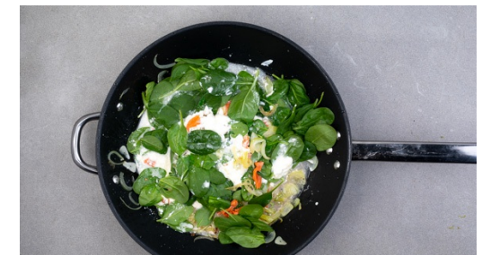
6. Spinat untermischen

Währenddessen die Kirschtomaten halbieren und den Käse fein reiben.