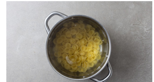
3. Pasta kochen

Den Seelachs abtropfen und in Streifen schneiden.