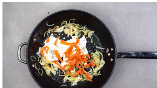
4. Sauce ansetzen

Ca. 3/4 der Orecchiette im kochenden Wasser in ca. 8-10Min. bissfest kochen. In ein Sieb abgießen, mit kaltem Wasser abschrecken und abtropfen lassen. 50ml Pastawasser dabei auffangen. Tipp: Wer großen Hunger hat, bereitet einfach alle Nudeln zu.