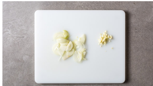
1. Zwiebel schneiden

Kalorien 850.0kcal, Fett 32.5g, Eiweiß 30.0g, Kohlenhydrate 104.9g