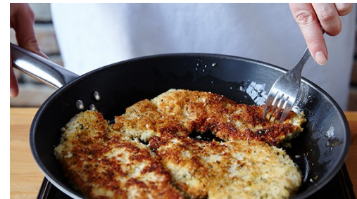
5. Kip bakken

Leg de kipfilets tussen twee vellen bakpapier en sla het vlees gelijkmatig met een zwaar voorwerp plat, tot het ca. 0,5cm dik is. Wrijf het vlees in met zout en peper. Klop 2 eieren los in een kom en breng op smaak met zout en peper. Doe 6el bloem op een bord. Meng op een tweede bord de panko met de gedroogde oregano en een snuf peper en zout.