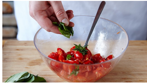
1. Salade maken

calorieën 561.0kcal, vet 27.5g, eiwit 44.7g, koolhydraten 29.0g