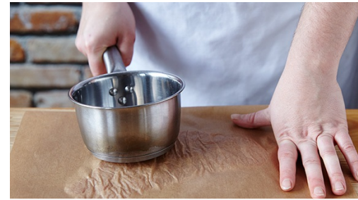
2. Beslag maken

Haal de kipfilets stuk voor stuk eerst door de bloem (schud daarbij overtollig bloem af), dan door het eimengsel en tot slot door de panko . Zorg ervoor dat de kip goed bedekt is.