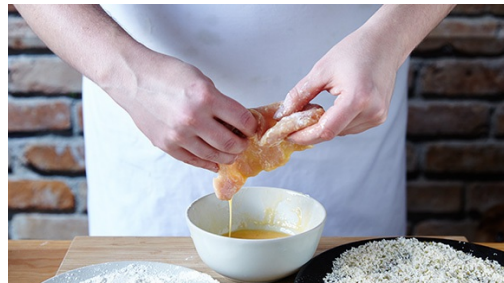
4. Kip door beslag halen

Verwarm de oven voor op 200°C. Snijd de cherrytomaten in vieren en doe ze in een kleine kom. Scheur de basilicumblaadjes grof en voeg ze aan de kom toe. Maak in een 2e kommetje een dressing van 1el azijn, 1el olijfolie, zout en peper. Rasp de citroenschil fijn en snijd de citroen in partjes.