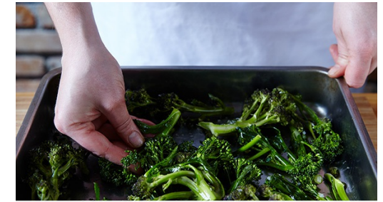
3. Broccoli roosteren

Verhit 3el olijfolie in een grote koekenpan op middelhoog vuur en bak de kipfilets in 4-5min per zijde goudbruin en gaar. Zet het vuur evt. iets lager mocht de panko te donker kleuren. Houd de kip warm tot het serveren. Neem de geroosterde broccoli uit de oven en bestrooi met 1tl citroenrasp .