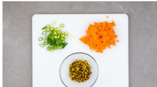
4. Salade voorbereiden

Verwarm de oven voor op 220°C. Breng 600ml gezouten water in een middelgrote kookpan aan de kook. Rasp de citroenschil en sinaasappelschil fijn. Pers de citroen en 1 sinaasappelhelft boven een kom uit. Snijd de rest van de sinaasappel in partjes. Pel en hak de knoflook fijn. Pluk de muntblaadjes en hak ze grof, doe de steeltjes weg.