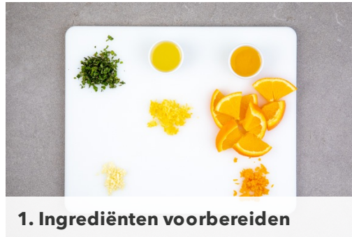
1. Ingrediënten voorbereiden

calorieën 831.0kcal, vet 29.1g, eiwit 45.2g, koolhydraten 87.1g