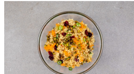
5. Salade maken

Doe de satéprikkers in een kom water, dit voorkomt splinteren. Meng de rasp van de citroen en sinaasappel met 1/3e van de munt , de knoflook , 1-2el olijfolie en zout en peper in een kom. Roer dan de kipstukjes door de marinade . Rijg de kipstukjes en sinaasappelstukjes om en om aan de satéprikkers .