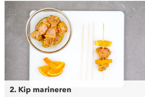
2. Kip marineren

Snijd de bosui in dunne ringen. Schil de wortels en rasp ze fijn. Verhit een droge, kleine koekenpan op middelhoog vuur en rooster de pistachenoten in 2-3min goudbruin. Let op, de noten kunnen snel verbranden! Neem de pistachenoten uit de pan, laat ze iets afkoelen en hak grof.