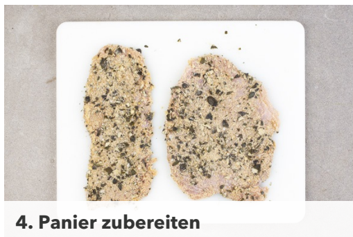
4. Panier zubereiten

Backrohr auf 200°C Umluft vorheizen. Die Erdäpfel schälen und in 1cm dicke Scheiben schneiden, dann die Scheiben in 1cm dicke Würfel schneiden. Erdäpfelwürfel auf ein mit Backpapier belegtes Backblech verteilen und mit 1TL Salz, 1-2EL Olivenöl und 2EL der Gewürzmischung vermengen.