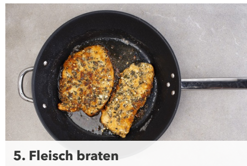
5. Fleisch braten

Die Erdäpfel im Backrohr ca. 18-20Min. knusprig und goldbraun backen. Währenddessen 1TL Zitronenschale abreiben und mit 1EL zimmerwarmer Butter und 1 Prise Salz vermengen.