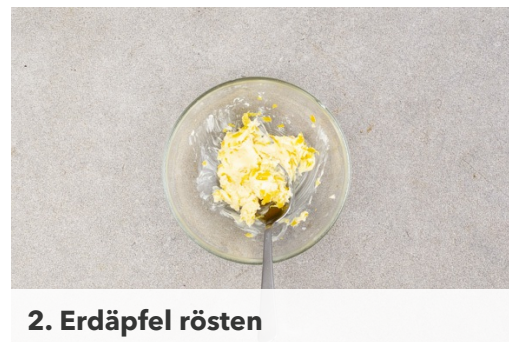
2. Erdäpfel rösten

Nun 4EL Mehl auf einem Teller verteilen. Eier in einem tiefen Teller verquirlen und mit einem Schuss Wasser vermengen. Kürbiskerne und Semmelbrösel mit 1-1,5TL Salz auf einem weiterem Teller vermengen. Schnitzel nun erst im Mehl wenden, dann gleichmäßig mit dem Ei bedecken und zuletzt in der Kürbiskernmischung wenden.