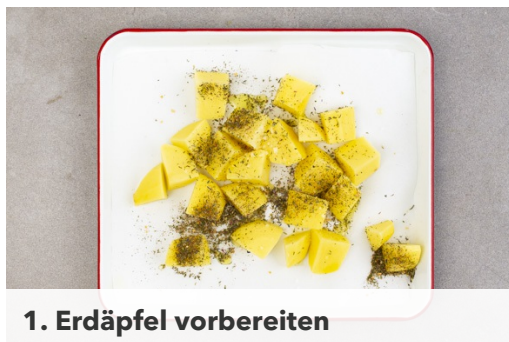
1. Erdäpfel vorbereiten

Kalorien 771.0kcal, Fett 33.9g, Eiweiß 48.8g, Kohlenhydrate 62.5g