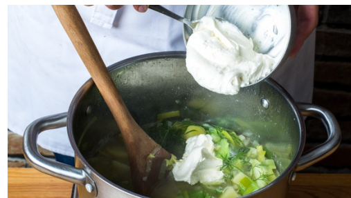
5. Crème fraîche einrühren

Die Kartoffeln , die Zwiebeln und den Lauch in einem großen Topf mit 1EL Pflanzenöl bei mittlerer Hitze ca. 2-3Min. anschwitzen. Mit 750ml Wasser ablöschen und den Brühwürfel darin auflösen. Den Eintopf ca. 8-9Min. köcheln lassen.