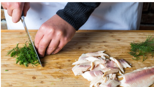
4. Fisch vorbereiten

Die Kartoffeln schälen und in ca. 1-2cm große Stücke schneiden. Die Zwiebel schälen, halbieren und in dünne Scheiben schneiden. Den Lauch gründlich waschen und in ca. 0,5cm breite Ringe schneiden.