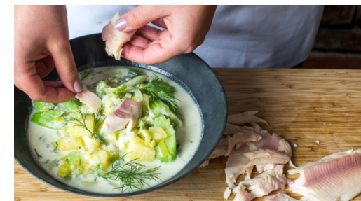
6. Anrichten und servieren

Inzwischen den Sellerie schräg in ca. 1cm breite Streifen schneiden. Nach ca. 3Min. Kochzeit mit in den Eintopf geben und alles weitere 5-6Min. köcheln lassen.