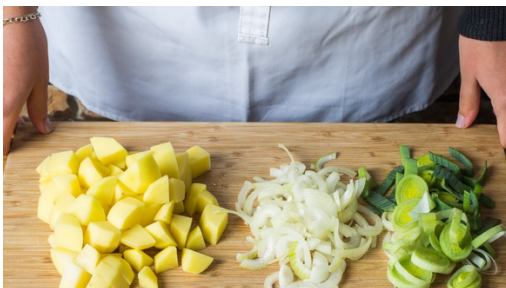
1. Gemüse vorbereiten

Kalorien 580.0kcal, Fett 32.2g, Eiweiß 21.9g, Kohlenhydrate 46.2g