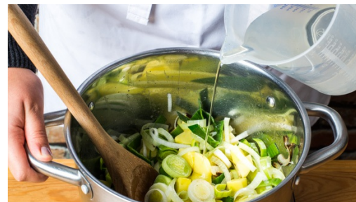
2. Eintopf ansetzen

Die Forellenfilets in mundgerechte Stücke schneiden und mit etwas Pfeffer würzen. Den Dill fein hacken, einige Dillspitzen als Garnitur beiseitelegen.