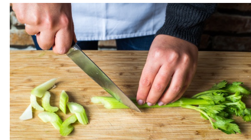
3. Sellerie schneiden

Nach Ende der Kochzeit die Crème fraîche und den gehackten Dill in den Eintopf einrühren. Mit Salz und Pfeffer abschmecken.