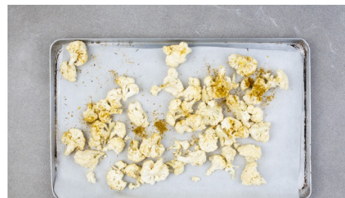
2. Karfiol rösten

Die Linsen und Kokosraspeln dazugeben und mit 500ml Wasser und Kokosmilch ablöschen und zum Kochen bringen. Linsen insgesamt ca. 15-18Min. kochen lassen, dabei gelegentlich umrühren und ggf. Wasser nachgießen. Nach ca. 5Min. Kochzeit die Tomaten dazu geben. Mit Salz und Pfeffer würzen.