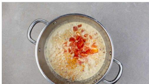
4. Linsen hinzugeben

Backrohr auf 180°C Umluft vorheizen. Zwiebeln , Ingwer und Knoblauch schälen. Zwiebeln halbieren und fein würfeln, Ingwer fein reiben und Knoblauch hacken. Karfiol in kleine Röschen aufteilen. Tomaten halbieren, Strunk entfernen und in 1cm große Stücke schneiden.