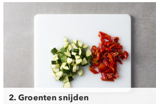
2. Groenten snijden

Rasp 1-2tl schil van de sinaasappels boven de pan met groenten en roer door ( zie kooktip, links ). Houd de groenten warm. Schil de sinaasappels en snijd het sinaasappelvruchtvlies vervolgens in partjes. Hak de peterselie zonder hardere steeltjes grof. Snijd de gerookte kipfilets in plakken.