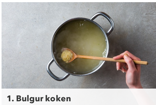
1. Bulgur koken

calorieën 635.0kcal, vet 22.7g, eiwit 32.6g, koolhydraten 70.0g