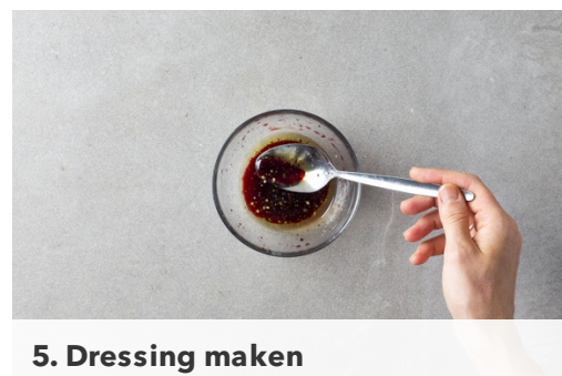
5. Dressing maken

Snijd intussen de courgettes in de lengte in vier lange repen en dan in stukjes. Hak de gegrilde paprika grof.