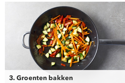
3. Groenten bakken

Maak een dressing van de granaatappelsiroop , 2-3el olijfolie, 1el azijn, peper en zout. Meng de bulgur met de dressing , gebakken groenten , geroosterde pompoenpitten , sinaasappelrasp en de helft van de peterselie . Proef en breng evt. op smaak met extra peper en zout.