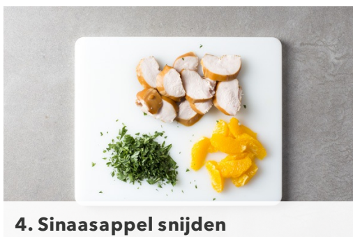
4. Sinaasappel snijden

Breng 1L water in een middelgrote kookpan met een snuf zout aan de kook. Voeg de bulgur toe zodra het water kookt en kook de bulgur met een deksel afgedekt op middellaag vuur in 10-12min gaar. Giet de bulgur af in een zeef, doe terug in de pan en roer los met een vork.