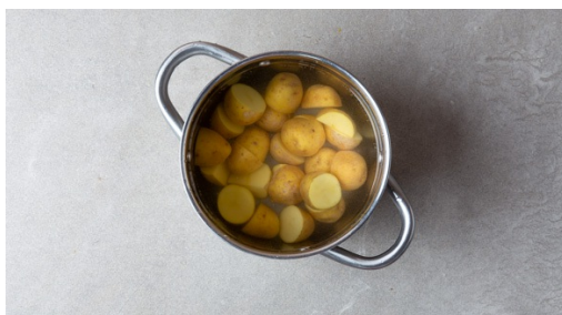
1. Krieltjes koken

calorieën 590.0kcal, vet 31.7g, eiwit 23.3g, koolhydraten 48.1g