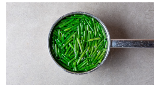
3. Sperziebonen koken

Hak de kervel zonder de harde steeltjes grof. Meng 2el truffelolie met 1el azijn, 1/4tl zout en peper naar smaak. Doe de gekookte krieltjes met de dressing en kervel in een grote kom en schep om.