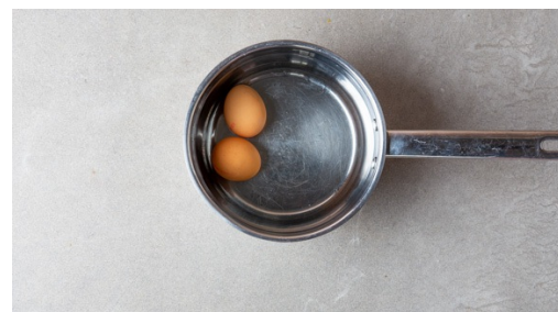
2. Eieren koken

Verhit een grote koekenpan op middelhoog vuur en voeg de spekjes toe zodra de pan heet is. Voeg na 2min bakken de spitskoolreepjes en ui toe en bak 5-6min al regelmatig roerend. Voeg de ui later toe als je van een sterkere uiensmaak houdt.