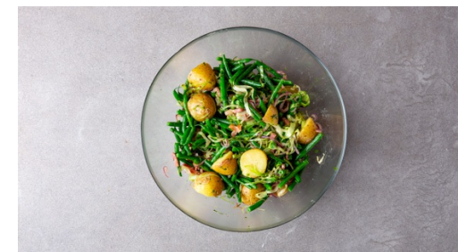
6. Salade maken

Breng opnieuw water in de waterkoker aan de kook. Dop de sperziebonen en halveer ze. Doe het gekookte water in de gebruikte, kleine kookpan en voeg een snuf zout toe. Kook de sperziebonen ca. 5-6min tot ze gaar zijn. Kook ze 1-2min langer voor een minder stevige beet.