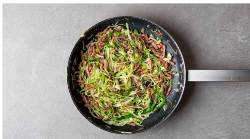
4. Spekjes bakken

Breng ruim water in een waterkoker aan de kook. Schrob de krieltjes onder de kraan schoon en snijd ze doormidden. Snijd grotere krieltjes in vieren. Doe de krieltjes in een middelgrote kookpan en overgiet ze met het gekookte water tot ze net onderstaan. Voeg een snuf zout toe en breng aan de kook. Kook de krieltjes in ca. 15min gaar en giet ze af.