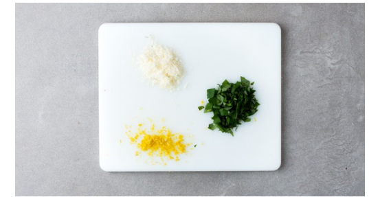
3. Pasta kochen

In der Zwischenzeit, eine kleine Pfanne auf mittlere Stufe erhitzen und Walnüsse 1Min. anrösten. Vorsicht, sie verbrennen schnell! Das restliche Basilikum mit 1TL Zitronenschale und Walnüsse auf einem Schneidebrett mit einem Messer sehr fein hacken, bis alles gut vermengt ist. Gremolata mit etwas Salz und Pfeffer würzen.