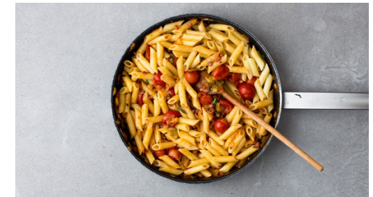
6. Pasta fertigstellen

Sobald das Wasser kocht, Penne für ca. 7-9Min. kochen, danach abgießen und dabei etwas Pastawasser auffangen. Währenddessen die Schale der Zitrone abreiben, den Saft auspressen und Basilikumblätter von den Stielen zupfen und grob hacken. Käse fein reiben.