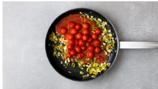
4. Sauce zubereiten

Jungzwiebeln putzen, längs halbieren und dann in feine Streifen schneiden. Einen großen Topf mit 1TL Salz und Wasser zum Kochen bringen. Große Pfanne mit 1TL Öl erhitzen und die Speckwürfel ca. 3-4Min. oder bis sie knusprig werden, anbraten. Speck anschließend aus der Pfanne nehmen.