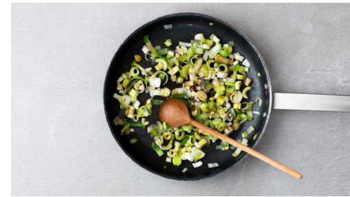
2. Lauch anbraten

Die Tomaten nach den vergangenen 10Min. zu den Jungzwiebeln hinzugeben. Gut umrühren und weitere 5-6Min. mit Deckel kochen lassen. Anschließend 1-2TL Zitronensaft und Käse zugeben. So lange rühren bis der Käse geschmolzen ist und eine cremige Sauce entsteht. Mit Salz und Pfeffer würzen und Hälfte des Basilikums unterrühren.