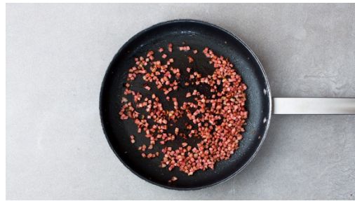
1. Speck anbraten

Kalorien 934.0kcal, Fett 38.7g, Eiweiß 36.7g, Kohlenhydrate 104.9g