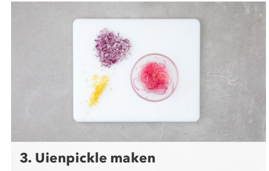
3. Uienpickle maken

Hak de dille fijn. Meng de gehakte dille , helft van de yoghurt met 1tl citroenrasp in een kommetje. Proef en breng de dip op smaak met peper en evt. zout. Voeg evt. meer yoghurt toe of pureer de dip glad met een staafmixer. Gebruik de rest van de yoghurt voor een ander recept.