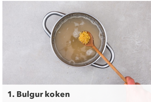
1. Bulgur koken

calorieën 699.0kcal, vet 24.8g, eiwit 37.2g, koolhydraten 72.9g