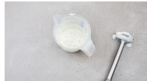
5. Saus maken

Wrijf intussen de kippendijfilets in met de Habesha's spice mix , 1el olijfolie, zout en peper. Verhit een middelgrote koekenpan op middelhoog vuur en leg de kip in de pan. Bak 5-7min op een kant, beweeg de kip niet. Keer de kip om en bak in nog eens 5-7min gaar. Neem de kip uit de pan en laat zeker 5min rusten. Snijd dan in plakken.