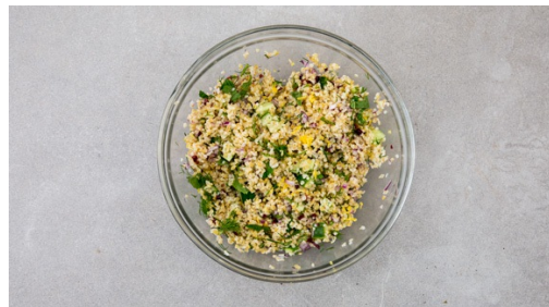
4. Bulgursalade maken

Breng 600ml water met een snuf zout in een middelgrote kookpan aan de kook. Voeg de bulgur toe zodra het water kookt, breng het water opnieuw aan de kook, doe een deksel op de pan en kook de bulgur op middellaag vuur in 8-10min beetgaar. Giet indien nodig het water af, laat de bulgur uitlekken in een zeef en doe dan terug in de pan.