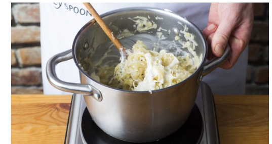
6. Sauerkraut mischen

Die Milch mit der Hälfte des Brühwürfels auf mittlerer Hitze aufkochen, dann mit Rosmarin , Salz und Pfeffer sowie nach Geschmack mit Muskat abschmecken. Die Gewürzmilch mit den Eiern sowie 3/4 der Petersilie unter das Brot mischen und gut miteinander vermengen, mit Salz und Pfeffer abschmecken.