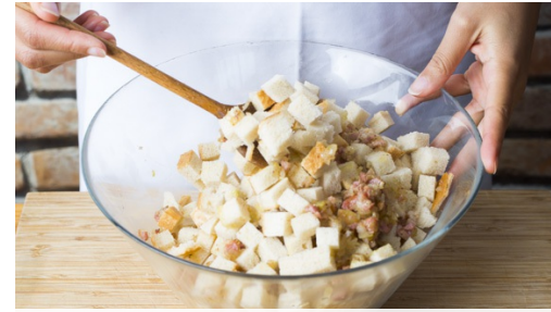
2. Speck anbraten

Nun 2-3 Lagen Klarsichtfolie leicht überlappend auslegen und einen Teil der Masse mittig darauf verteilen, wie eine Wurst eindrehen und die Enden zubinden. Mit dem restlichen Knödeteig wiederholen, bis ca. 2-3 gleichmäßig dicke Rollen entstanden sind. Die Rollen für ca. 15-20Min. im Wasser leicht köcheln lassen.