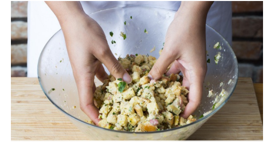
3. Gewürzmilch mischen

Inzwischen die Karotten schälen und in ca. 1cm schräge Scheiben schneiden, mit Salz, Pfeffer, 1 Prise Zucker und 1-2EL Olivenöl mischen und auf einem mit Backpapier ausgelegten Backblech im Ofen ca. 12-15Min. bissfest garen.