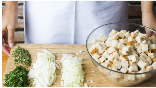
1. Brot schneiden

Kalorien 780.0kcal, Fett 44.5g, Eiweiß 21.7g, Kohlenhydrate 68.9g