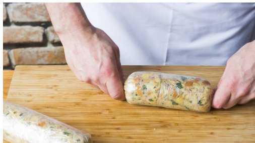
4. Knödel formen

Einen großen Topf mit ausreichend Wasser für die Knödel aufsetzen. Den Ofen auf 200°C Umluft oder 220°C Ober-/Unterhitze vorheizen. Die Zwiebeln schälen, eine in feine Würfel schneiden, die zweite in feine Streifen. Das Brot in ca. 1cm große Würfel schneiden. Die Petersilie samt Stängel fein hacken, den Rosmarin vom Stängel streifen und fein hacken.