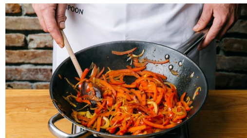
2. Paprika bakken

Halveer, pel en snijd de ui in dunne halve ringen.