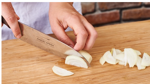
1. Ui snijden

calorieën 707.0kcal, vet 25.9g, eiwit 18.6g, koolhydraten 96.3g