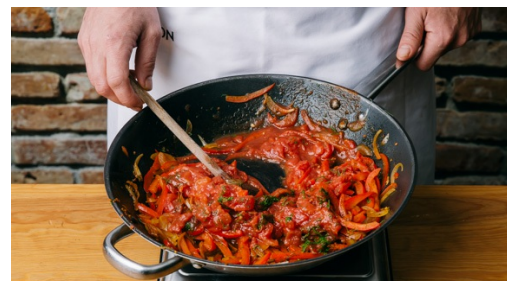
5. Sugo maken

Verhit een grote koekenpan met 1-2el olijfolie op middelhoog vuur en bak de gnocchi in 8-10min rondom goudbruin en knapperig. Roer regelmatig door en breng op smaak met peper en zout. Houd de gnocchi warm tot aan het serveren.