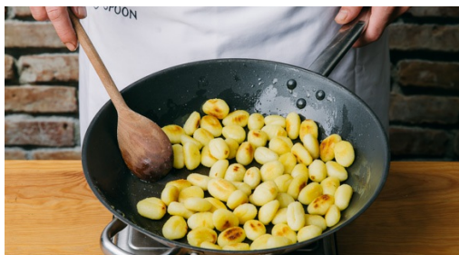
4. Gnocchi bakken

Hak intussen de dille zonder de harde steeltjes fijn, houd een paar dunnere dilletakjes apart voor stap 6. Snijd de bosui schuin in smalle ringen.