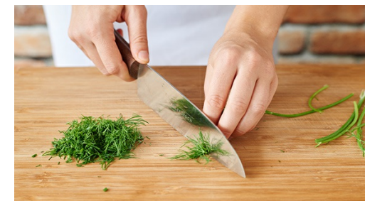
3. Dille snijden

Verhit 2el olijfolie in een grote koekenpan of hapjespan en bak de ui en paprikareepjes met de László's goulash spice mix 5-6min. Voeg evt. een scheutje water toe om de paprika en ui makkelijker te laten garen. Breng op smaak met peper en zout.