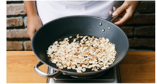
3. Mandeln rösten

Die Kartoffeln und Pastinaken auf ein mit Backpapier ausgelegtes Backblech verteilen, mit 1-2EL Olivenöl und Salz mischen und für ca. 25-20Min. im Ofen backen. Zu Hälfte der Zeit einmal wenden.