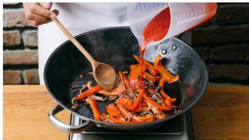
4. Paprikasauce vorbereiten

Inzwischen in einer großen Pfanne die Mandeln ohne Öl auf niedriger bis mittlerer Hitze anrösten. Vorsicht! Die Mandeln können schnell anbrennen. Die Mandeln aus der Pfanne nehmen, die Pfanne aufheben.