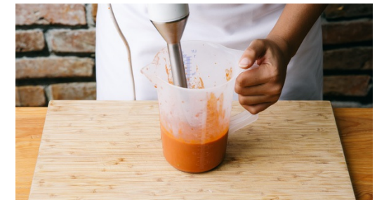
6. Sauce fertigstellen

Inzwischen den Knoblauch schälen und vierteln, die Petersilie samt Stängel grob hacken und beides mit 1EL Essig sowie Mayonnaise und Salz mit einem Stabmixer fein pürieren. Ggfs. 2EL Wasser hinzufügen, bis eine cremige Paste entstanden ist.