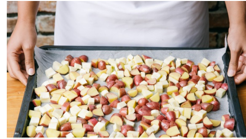
2. Gemüse backen

Den Ofen auf 200°C Umluft oder 220°C Ober-/Unterhitze vorheizen. Die Kartoffeln in ca. 1,5cm große Würfel schneiden. Die Pastinaken schälen und in ca. 1cm große Würfel schneiden. Die Zwiebel schälen, halbieren und in dünne Scheiben schneiden. Die Paprika entkernen und in dünne Streifen schneiden.