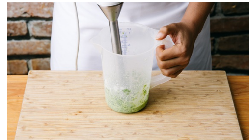
5. Aioli mischen

Die Pfanne erneut mit 1EL Olivenöl mittelhoch erhitzen und die Zwiebeln und Paprika ca. 5-8Min. anbraten, mit Salz, Pfeffer und geräucherter Paprika würzen. Die Hitze runterdrehen und die passierten Tomaten mit 1-2EL Wasser hinzufügen und für ca. 10Min. leicht köcheln lassen.