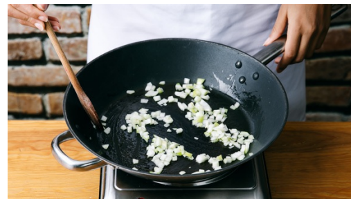
2. Zwiebeln anbraten

Inzwischen den Meerrettich mit einem Teelöffel schälen und reiben. Vorsicht! Meerrettich ist sehr scharf. Am besten am offenen Fenster oder unter dem Dunstabzug bearbeiten. Den Meerrettich mit der Crème fraîche vermengen, evtl. mit Salz nachschmecken. Den Lachs ggfs. von der Haut lösen und in grobe Stücke teilen.