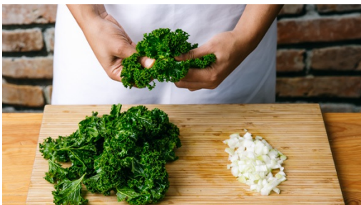
1. Zwiebel schneiden

Kalorien 890.0kcal, Fett 69.7g, Eiweiß 27.2g, Kohlenhydrate 37.1g