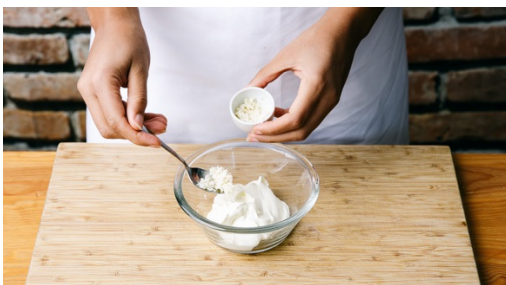
4. Meerrettichcreme mischen

Den Backofen auf 200°C Ober-/Unterhitze oder 180°C Umluft vorheizen. Die Zwiebel schälen, halbieren und in feine Würfel schneiden. Den Grünkohl in grobe Stücke zupfen, die harten Stiele ggfs. entfernen.