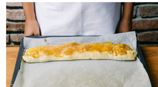
6. Strudel backen

Nun den Grünkohl zu den Zwiebeln geben und ca. 3-4Min. mitbraten, bis er zusammenfällt. Mit Salz und Pfeffer abschmecken.