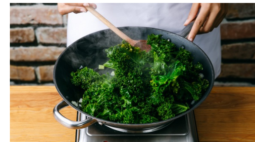
3. Grünkohl anbraten

Nun die Blätterteige mit dem Papier ausrollen. Die Meerrettichcreme mittig verstreichen, das längs ein ca. 1-2cm dicker Rand bleibt. Gleichmäßig den Lachs und den Grünkohl darauf verteilen und vorsichtig einrollen. Auf den Falst legen und die Enden mit einer Gabel zusammen drücken. Wer mag, kann die Teige mit etwas Öl einstreichen.