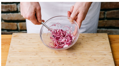
4. Pickles maken

Verwarm de oven voor op 200°C hetelucht/220°C. Halveer de paprika's , verwijder het steeltje en de zaadlijsten. Snijd de groenten in 1cm brede repen.