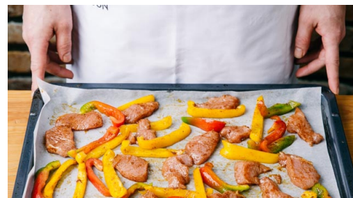
2. Vulling voorbereiden

Rasp intussen de limoenschil fijn. Halveer de limoen en pers een helft uit. Halveer, pel en snijd de uien in dunne halve ringen. Doe de ui in een kom met 1el limoensap , 1el water, een snufje suiker en wat zout en peper. Roer om te mengen en laat staan tot stap 6.