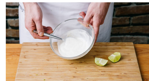
6. Limoenyoghurt maken

Bak de groenten en het vlees 20-25min in de oven tot het kalkoenvlees goed bruin is en de paprika's beginnen te verkleuren.