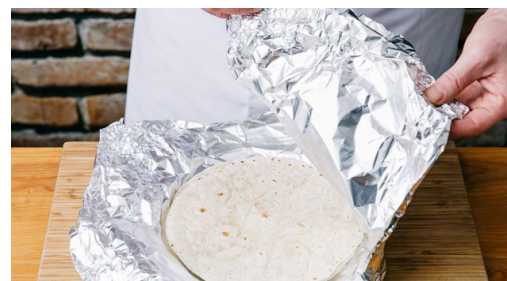
5. Wraps opwarmen

Leg de kalkoenstukjes met de paprikareepjes op een bakplaat met bakpapier, meng met de chili con carne spice mix , 1el olijfolie en 1el suiker (bij voorkeur bruine suiker)