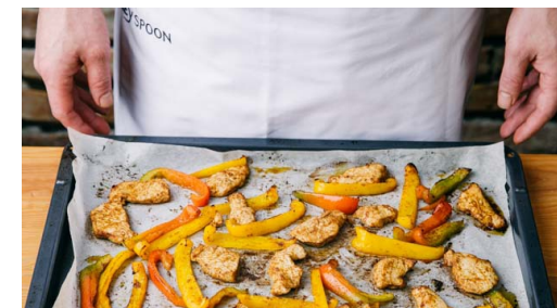
3. Vulling roosteren

Haal de tortilla's van elkaar los, wikkel ze in aluminiumfolie en bak ze in de laatste 5min mee in de oven.