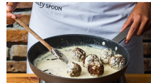
6. Saus maken

Meng intussen in een kom het gehakt met de Mediterraanse kruidenmix en het paneermeel , breng op smaak met zout en peper en kneed goed. Rol van het gehakt 12 gehaktballen, ca. 3cm groot.