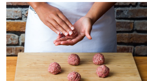
3. Gehaktballen maken

Verhit intussen 1el olijfolie in een grote koekenpan op middelhoog vuur. Voeg de gehaktballen toe als de olie heet is en bak ze in 6-8min rondom goudbruin en gaar. Neem uit de pan, zet op een bord opzij.