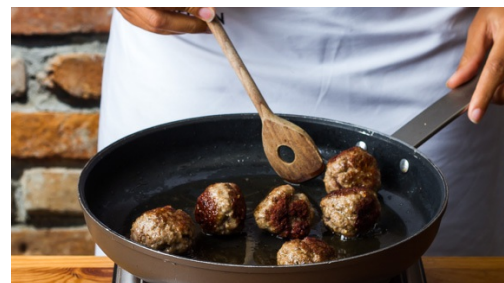
5. Gehaktballen bakken

Boen ondertussen de wortels schoon en snijd ze schuin in 1cm dikke plakjes. Maak de spruitjes schoon en hussel de groenten in een kom om met 1el olijfolie, peper en zout. Verdeel de groenten over een bakplaat met bakpapier en bak ca. 10min in de oven.