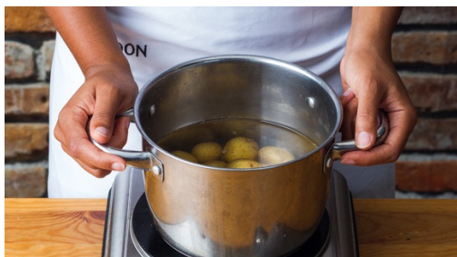
1. Krieltjes koken

calorieën 750.0kcal, vet 35.8g, eiwit 36.7g, koolhydraten 62.5g