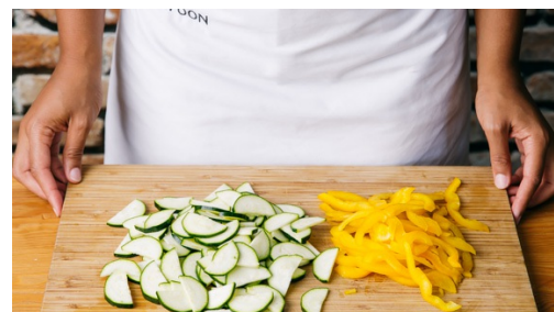
2. Groenten snijden

Maal uit je pepermolen 1el zwarte peper of meet 0,5el gemaalde zwarte peper af ( zie kooktip, links ).