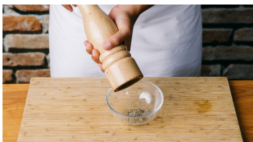
4. Peper malen

Breng 800ml water met een snuf zout in een middelgrote kookpan aan de kook. Was de basmatirijst in een zeef totdat het water helder is. Voeg de rijst toe zodra het water kookt, breng opnieuw aan de kook en kook de rijst op laag vuur met een deksel afgedekt in 10-12min beetgaar. Neem van het vuur en laat de rijst afgedekt 5min rusten.