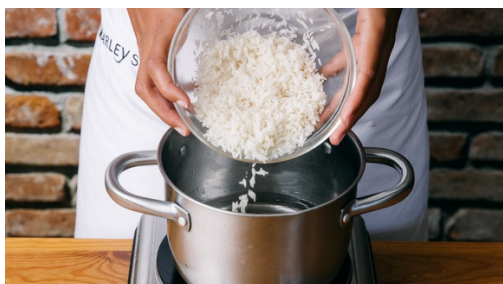
1. Rijst koken

calorieën 640.0kcal, vet 13.3g, eiwit 34.9g, koolhydraten 91.4g