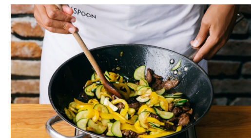
6. Vlees wokken

Snijd het wit van de bosui in dunne ringen en houd apart. Snijd het groen schuin in dunne ringen.