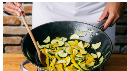
5. Groente wokken

Snijd intussen de courgette in de lengte doormidden en dan in 0,5cm brede plakjes. Halveer de paprika's en verwijder zaden en zaadlijsten. Snijd de paprika's in 0,5cm brede repen.