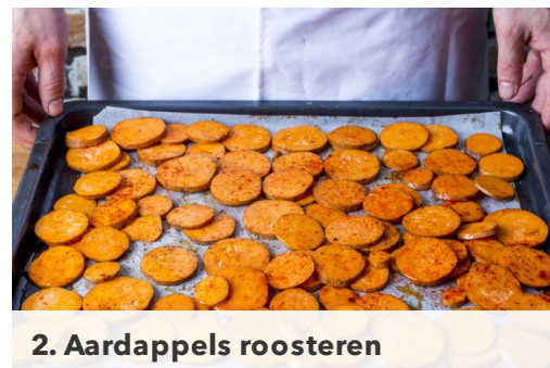
2. Aardappels roosteren

Verwarm de oven voor op 200°C hetelucht/220°C. Wrijf de drumsticks in met 1el plantaardige olie, de helft van het gerookte paprikapoeder , peper en zout. Leg ze op een bakplaat met bakpapier en schuif direct onderin de oven.