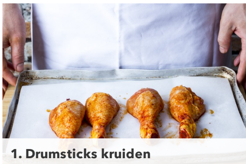
1. Drumsticks kruiden

calorieën 650.0kcal, vet 27.6g, eiwit 33.6g, koolhydraten 59.6g