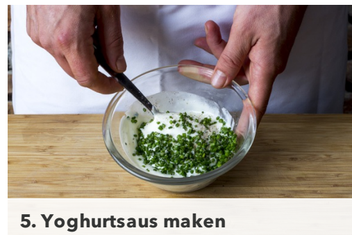
5. Yoghurtsaus maken

Halveer de mini-komkommers in de lengte en snijd in dunne plakjes. Snijd de tomaten in blokjes van 1-2cm. Doe de tomaat en komkommer in een kom.