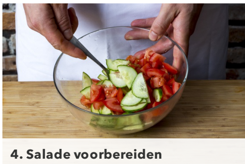
4. Salade voorbereiden

Rasp intussen de limoenschil fijn. Pers de limoen uit in een kom. Halveer en pel de ui en snijd in flinterdunne halve ringen. Meng de uieren met de limoensap en een snuf suiker. Laat marineren en hussel af en toe om.