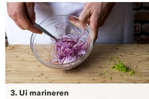
3. Ui marineren

Schrob intussen de zoete aardappels schoon en snijd in 0,5cm dikke schijfjes. Hussel om met de rest van het gerookte paprikapoeder en 1el plantaardige olie en leg ze op een tweede bakplaat met bakpapier. Bestrooi met zout en peper. Plaats bovenin de oven en bak ca. 15min. Wissel bakplaten om en bak nog 10-15min totdat de drumsticks en aardappels gaar zijn.