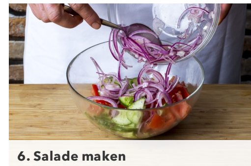
6. Salade maken

Snijd de bieslook fijn (of gebruik hiervoor een schaar). Roer 3/4 van de bieslook door de yoghurt en breng de sous op smaak met peper en zout.