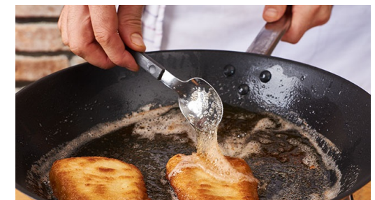
6. Schnitzel braten

Anschließend das Ei in einem tiefen Teller verquirlen, auf einen weiteren Teller 5-6EL Mehl geben, die Semmelbrösel auf einen dritten Teller geben. Die Schnitzel erst im Mehl, dann im Ei und anschließend in den Semmelbröseln wenden, bis diese vollständig mit der Panade bedeckt sind.