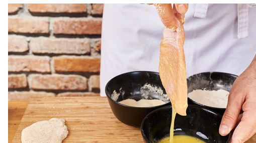
5. Schnitzel panieren

Währenddessen die Schnitzel evtl. unter eine Frischhaltefolie legen und wenn nötig auf 1cm gleichmäßig flachklopfen.