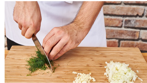
2. Gemüse vorbereiten

Kerngehäuse vom Kürbis mit einem Löffel heraus kratzen, Karotten schälen. Dann beides auf der Küchenreibe grob raspeln. In einer Schüssel mit einer Prise Salz verkneten und beiseitestellen.