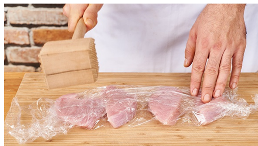
4. Schnitzel vorbereiten

Eine große Pfanne mit 2EL Öl mittelhoch erhitzen, Zwiebeln und Knoblauch ca. 1-2Min. glasig anschwitzen. 2TL Mehl darüber stäuben, kurz weiter rösten. Nun Kürbis-Karotten Mischung mit in die Pfanne geben. Mit Paprikapulver , Salz und Pfeffer abschmecken, dann 100ml Wasser dazugeben und alles unter regelmäßigem Rühren ca. 10-12Min. weich kochen.