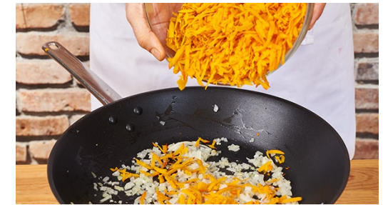
3. Kürbiskraut zubereiten

Zwiebeln schälen und klein würfeln, Knoblauchzehen ebenfalls schälen und pressen oder fein hacken. Dill ohne die harten Stiele grob hacken. Dill und Sauerrahm mit Salz und Pfeffer zu einem Dip rühren.