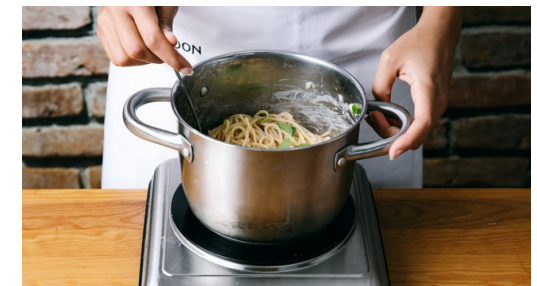
6. Pasta fertigstellen

Währenddessen eine mittlere Pfanne hoch erhitzen, dann das Fleisch darin pro Seite ca. 2Min. scharf anbraten. Die Temperatur anschließend auf niedrige Stufe reduzieren.