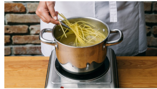
2. Spaghetti kochen

Paradeiser in dünne Streifen schneiden, die Pfanne mit 250ml Wasser ablöschen. Einen Hühnersuppenwürfel darin auflösen. Paradeiserstreifen, Knoblauch und Crème fraîche in die Pfanne geben und das Hendl in der Sauce weitere 7-8Min. köcheln.