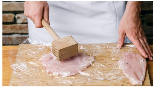
1. Hendl vorbereiten

Kalorien 868.0kcal, Fett 32.1g, Eiweiß 45.1g, Kohlenhydrate 97.3g