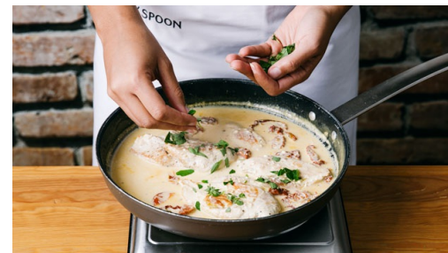
5. Oregano hacken

In einem mittelgroßen Topf ausreichend gesalzenes Wasser für die Pasta zum Kochen bringen. Sobald das Wasser kocht, die Spaghetti darin ca. 7-8Min. bissfest garkochen. Fertige Pasta in einem Sieb abgießen und eine halbe Tasse vom Pastawasser auffangen.