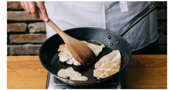
3. Hendl braten

Inzwischen Oregano von den Stielen zupfen und grob hacken. Rosa Pfeffer mit einem schweren Gegenstand zerdrücken und mit 1/2 des Oreganos in die Sauce geben. Sauce mit einer Prise Zucker, Salz und Pfeffer abschmecken.