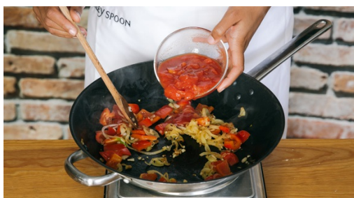
4. Groente bakken

Spoel de basmatirijst in een zeef onder koud water tot het water helder kleurt. Doe in een middelgrote kookpan met 800ml water en een snuf zout. Breng aan de kook op middelhoog vuur. Leg zodra het water kookt er een deksel op en zet het vuur laag. Kook de rijst in 10min gaar. Laat afgedekt tot het serveren staan.