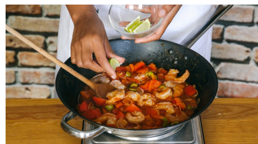
5. Stoof afmaken

Halveer intussen de ui , pel en hak ze fijn. Pel en hak de knoflook fijn. Halveer de olijven . Halveer de paprika , verwijder de zaden en zaadlijsten en snijd in 2cm grote stukjes. Snijd het kapje van jalapeñopeper , rol tussen je handen zodat de pitjes eruit regenen en snijd de peper in ringen. Snijd limoenen elk in 6-8 partjes.