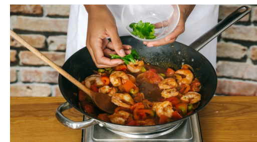
6. Koriander toevoegen

Pluk de korianderblaadjes en snijd de steeltjes heel fijn.