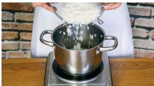
1. Rijst koken

calorieën 625.0kcal, vet 14.3g, eiwit 32.6g, koolhydraten 86.8g