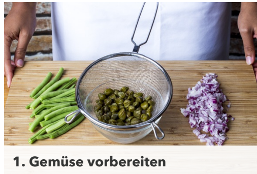
1. Gemüse vorbereiten

Kalorien 725.0kcal, Fett 24.1g, Eiweiß 44.0g, Kohlenhydrate 80.6g