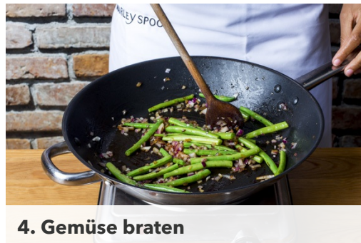
4. Gemüse braten

Inzwischen Fleisch trocken tupfen und gegen die Faser in möglichst dünner Streifen schneiden. In einer Pfanne 2EL Öl stark erhitzen und das Fleisch für 1-2Min. darin scharf anbraten, dabei kräftig mit Salz und Pfeffer würzen. Das Fleisch aus der Pfanne nehmen und für den Moment ruhen lassen.