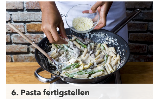
6. Pasta fertigstellen

Nun Ricotta , die Gewürzmischung , die Kapern und ca. 200ml Wasser zugeben und die Sauce für 2-3Min. köcheln lassen. Mit Salz und Pfeffer abschmecken.