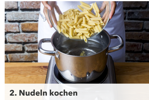
2. Nudeln kochen

In einem Kochtopf ausreichend gesalzenes Wasser zum Kochen bringen. Die Zwiebeln schälen und in feine Würfel schneiden. Die holzigen Enden der Fisolen entfernen. Die Kapern in einem Sieb abtropfen lassen.