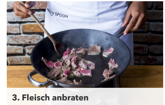
3. Fleisch anbraten

Sobald das Wasser kocht, die Nudeln darin ca. 8-9Min. bissfest garen. Die Nudeln durch ein Sieb abgießen, dabei eine Tasse Nudelwasser auffangen und Nudeln abtropfen lassen.