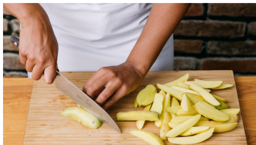
1. Kartoffeln schneiden

Kalorien 870.0kcal, Fett 35.9g, Eiweiß 44.9g, Kohlenhydrate 109.6g