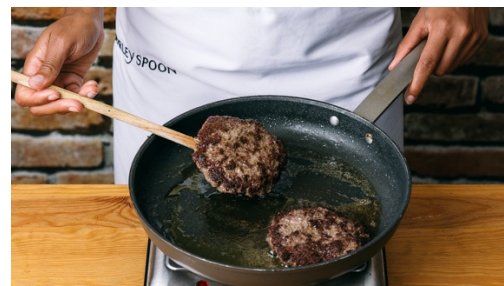
5. Fleisch braten

Hälfte der Burgerbrötchen in der Mitte durchschneiden und ca. 5Min. im Rohr aufwärmen. Sauerrahm mit Ketchup , Salz und Pfeffer zu einer würzigen Creme rühren. Käse fein reiben.