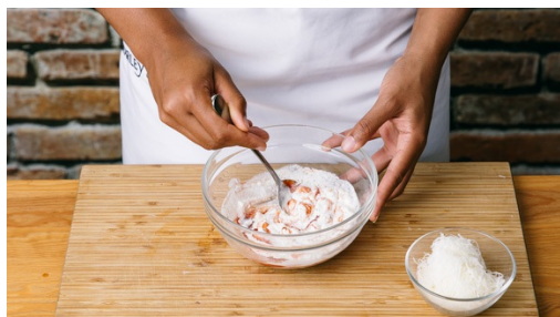
4. Sauce rühren

Inzwischen die Zucchini mit dem Sparschäler rundum in dünne Streifen abschälen. Die Zucchini streifen mit 4EL Essig, 2 Prisen Zucker, 2 Prisen Salz und 2-3TL der Scharfmacher-Mischung einlegen. Bis zum Schluss ziehen lassen.