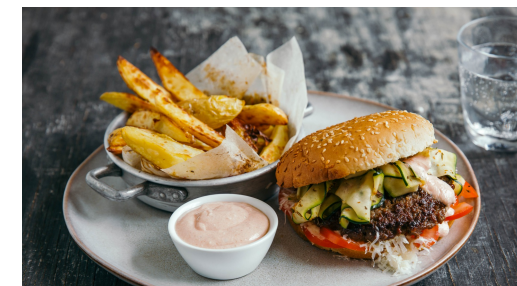
6. Burger zusammenstellen

Das Fleisch in 4 gleichgroße, ca. 1cm dicke Laibchen formen. Eine große Pfanne mit 2-3EL Öl hoch erhitzen. Die Burgerlaibchen darin auf jeder Seite ca. 2-3Min. anbraten, dann aus der Pfanne nehmen, salzen und pfeffern.