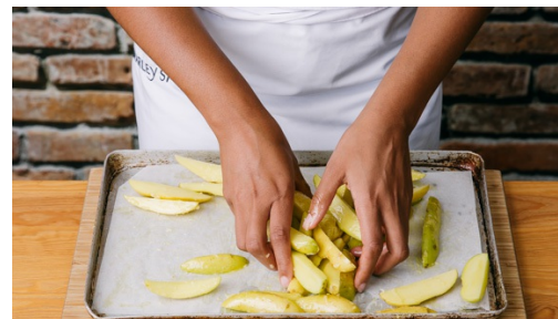
2. Kartoffeln backen

Backrohr auf 200°C vorheizen. Knoblauch schälen und pressen oder fein reiben. Kartoffeln gut waschen oder schälen und der Länge nach vierteln, größere Kartoffeln achteln.