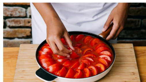
5. Paella bakken

Voeg de gemalen saffraan , 1/2 van het gerookte paprikapoeder , tomatenpuree en knoflook toe en bak 1min mee. Doe dan de risottorijst erbij en bak 2min tot de korrels glazig zijn. Breng op smaak met peper en evt. meer zout en gerookt paprikapoeder . Neem de pan van het vuur.