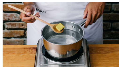
2. Bouillon maken

Verwarm de oven voor op 210°C hetelucht/230°C. Halveer de ui , pel en snipper fijn. Pel de knoflook en hak fijn. Snijd de vleestomaten in ca. 1cm dikke parten.