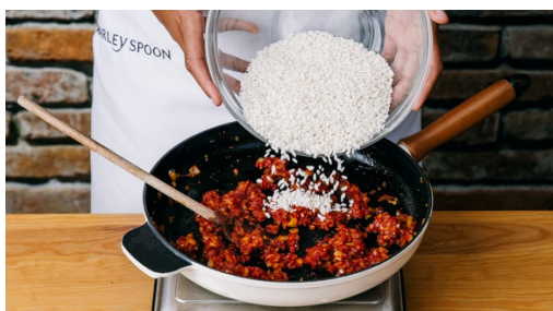
4. Rijst bakken

Verhit een grote, ronde ovenbestendige hapjespan op middelhoog vuur. Indien je deze niet hebt, kun je een grote koekenpan gebruiken. Voeg 1el olijfolie met de ui en een snuf zout toe en bak de ui in 3min glazig.