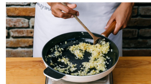
3. Paella starten

Breng 650ml water aan de kook en verkruiemel het bouillonblokje erboven. Roer om op te laten lossen.