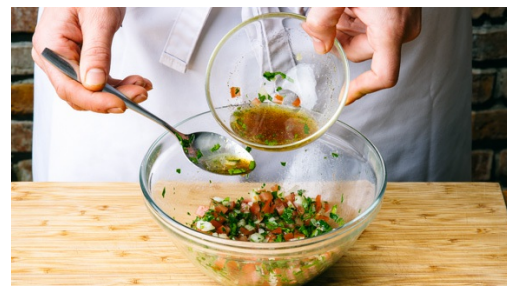
5. Salsa mischen

Inzwischen den Knoblauch schälen und fein hacken. Die Zwiebel schälen und fein hacken.