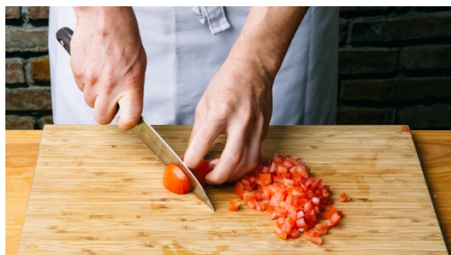
4. Tomaten schneiden

Backrohr auf 210°C Umluft vorheizen. Inzwischen die Süßkartoffel gut waschen, evtl. schälen, dann in 1-2cm dicke Stifte schneiden. Nun die Stifte auf dem mit Backpapier belegten Blech verteilen und mit 1EL Öl, Salz und Pfeffer würzen. Ca. 10-15Min. im Rohr backen, dann weitere ca. 3-5Min. auf höchste Grillstufe schalten und zu Ende backen.