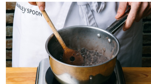
3. Bohnen köcheln

Die Petersilie ohne Stiele fein hacken. Übrige Zwiebeln, Tomaten und Petersilie vermischen. Mit 1-2EL Essig, 1EL Öl, Salz und Pfeffer würzen.