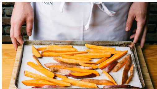
1. Kartoffeln backen

Kalorien 690.0kcal, Fett 29.9g, Eiweiß 17.1g, Kohlenhydrate 77.7g