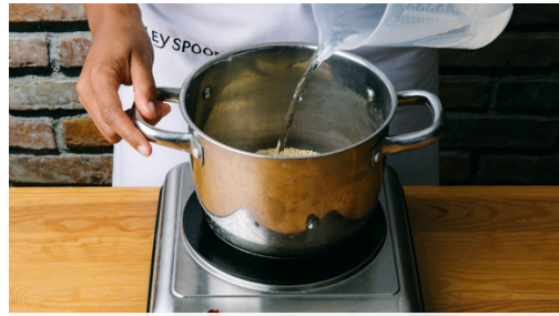
1. Quinoa koken

calorieën 640.0kcal, vet 24.7g, eiwit 37.0g, koolhydraten 59.7g