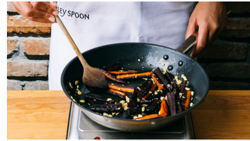
2. Wortels bakken

Pluk de blaadjes van de mint en dille en hak grof, gooi steeltjes weg.