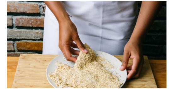
3. Vis paneren

Verhit 2el olijfolie in een grote koekenpan op middelhoog vuur. Leg de vis in de pan en bak 2min per kant tot de quinoa goudbruin is en de vis gaar is. De baktijd kan korter of langer zijn, afhankelijk van de dikte van de vis .