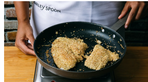
5. Vis bakken

Verhit een middelgrote koekenpan met 1-2el olijfolie op middelhoog vuur. Voeg de wortels met de helft van de shoarma-kruiden toe. Bak de wortels 5min en voeg dan de gehakte amandelen toe, bak deze 3-5min mee totdat de wortels beetgaar zijn. Schep af en toe om en breng op smaak met zout, peper en evt. meer shoarma-kruiden .