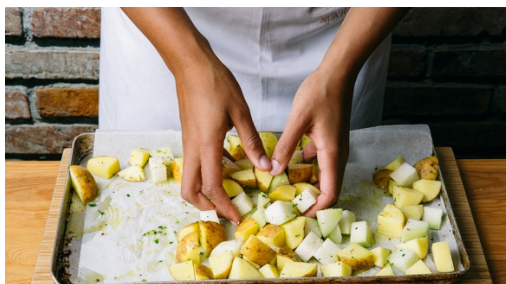
1. Groenten roosteren

calorieën 700.0kcal, vet 39.0g, eiwit 31.0g, koolhydraten 49.7g