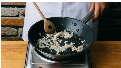
4. Sjalot bakken

Oven op 220°C hetelucht/240° voorverwarmen en/of BBQ voorverwarmen. Koolrabi en evt. aardappels schillen en beide groenten in 1-1.5cm grote blokjes snijden. koolrabi en aardappels met 1-2el olie mengen en op een bakplaat met bakpapier leggen. Bestrooi met peper en zout en bak in ca. 25min goudbruin en gaar. Schep de groenten halverwege de baktijd om.