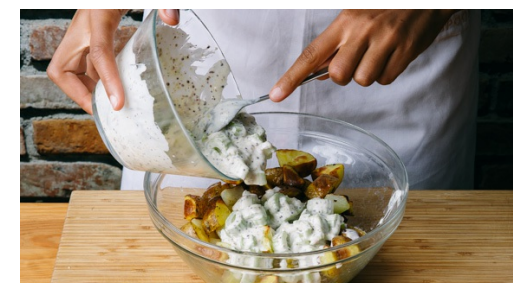
6. Salade maken

Ondertussen sjalotten en knoflook pellen, dan fijnhakken. Bleekselderij grof hakken. Bieslook fijnsnijden.