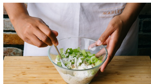
5. Yoghurtsaus maken

Elk kalfssaucijsje een paar keer met een vork inprikket. Saucijsjes met een dun laagje olie inwrijven en in een ovenschaal leggen. Na ca. 10min baktijd van de groenten , ovenschaal in de oven schuiven en de saucijsjes in 12-15min gaar bakken. Halverwege de baktijd omkeren. Bij gebruik van BBQ of grillpan: 8-12min bakken, geregeld omkeren.