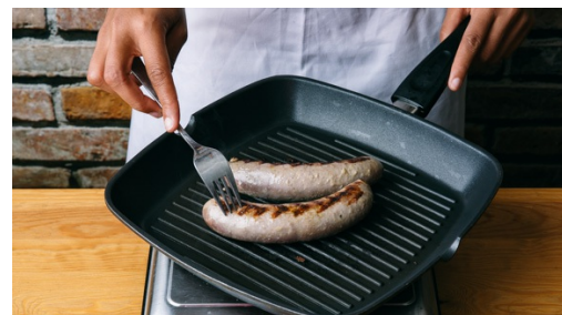
2. Saucijsjes roosteren

1el olie in een middelgrote koekenpan op middelhoog vuur verhitten en de sjalotten in 3-5min zacht fruiten. Knoflook toevoegen en 1min al regelmatig roerend meebakken. Dan knoflook-sjalotmengsel in een kom doen en laten afkoelen.